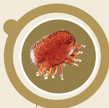
Imagen del ácaro Varroa destructor

Si hay resistencia al acaricida el tratamiento no será efectivo y las colonias podrían morir.