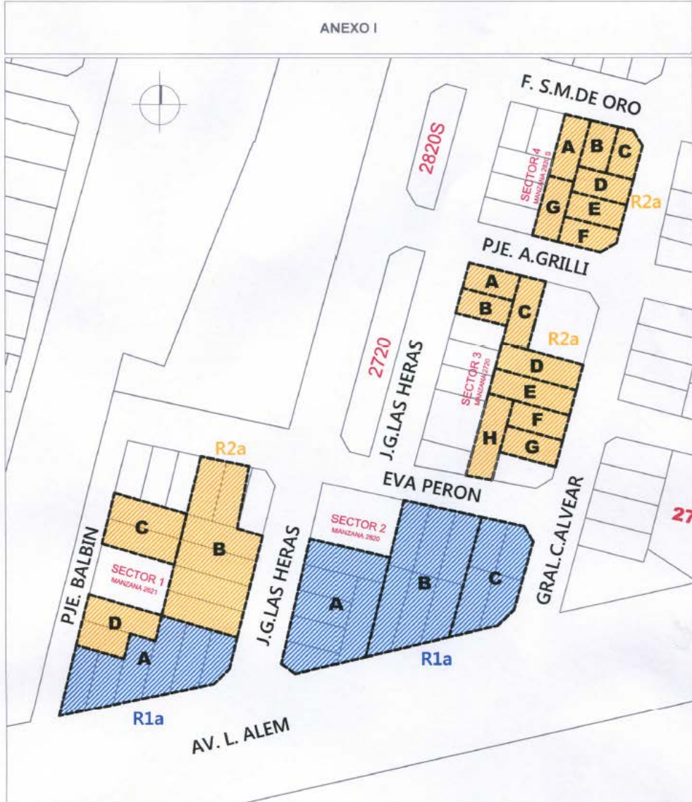
INDICADORES URBANISTICOS DEL DISTRITO R1a

Agencia de Administración de Bienes del Estado