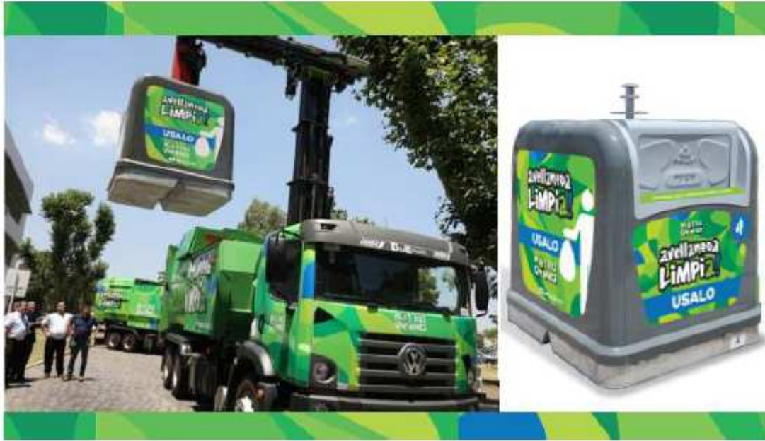
Imagen de carácter ilustrativo