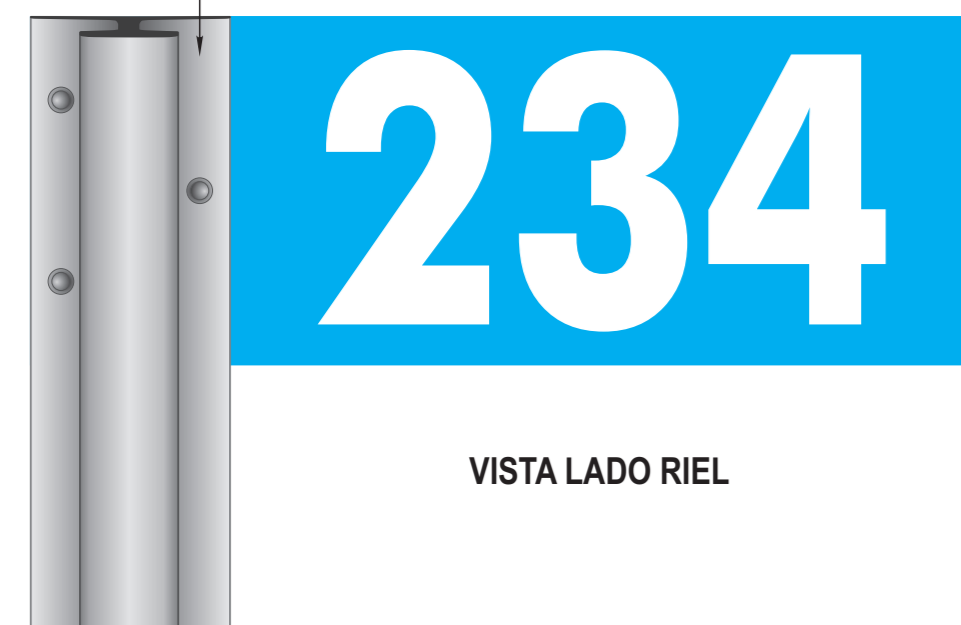
VISTA LADO RIEL