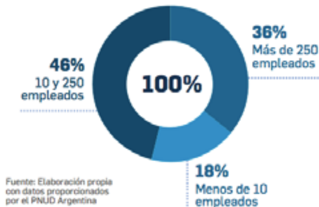
Gráfico 1: Tamaño de las empresas activas

http://pactoglobal.org.ar/wp-content/uploads/2017/12/Memoria_2016.pdf