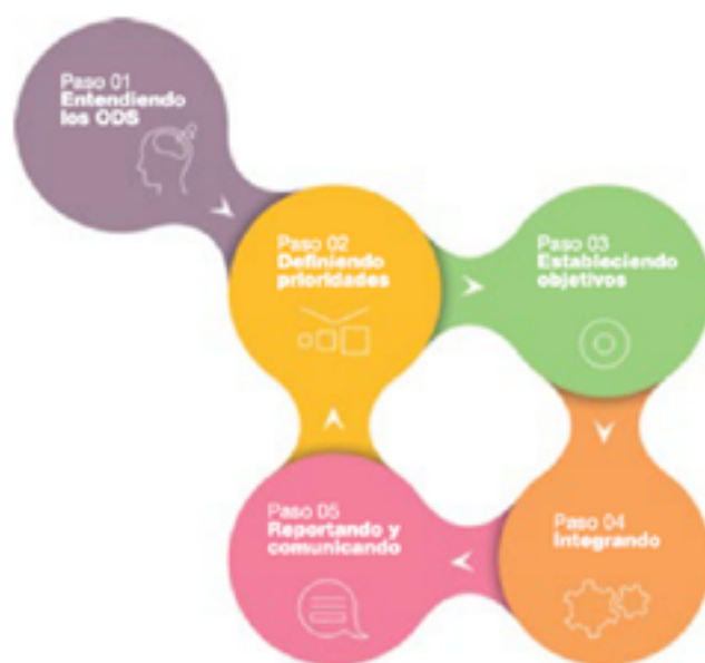
Figura 1: Metodología SDG Compass

El SDG Compass propone una metodología de 5 pasos para integrar los ODS a la estrategia de negocios (ver Figura 1).