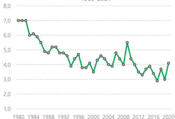
Tasa de Mortalidad Materna -por cada 10.000 nacidos vivos- 1980-2021

Fuente: elaboración propia en base a DEIS- Min. Salud