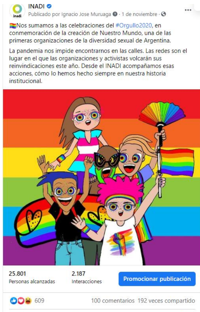
1 de Noviembre. Captura de pantalla de posteo realizado por la celebración del #Orgullo2020.