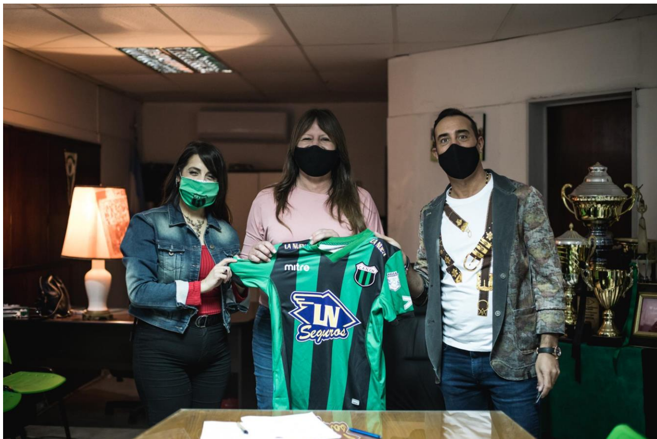
17 de Septiembre. Firma de convenio de capacitación con el Club Atlético Nueva Chicago.