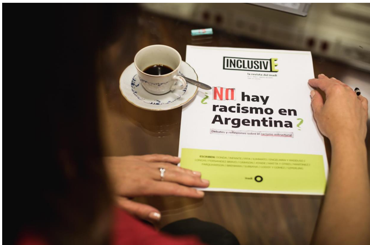
5 de Octubre. Lanzamiento de la Revista INCLUSIVE.