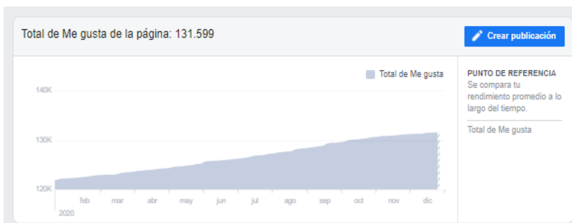
Curva de crecimientos de los seguidores de la cuenta oficial de Facebook del organismo durante el año.

Informe completo de las métricas del organismo: EX-2020-49356894- -APN-INADI#MJ