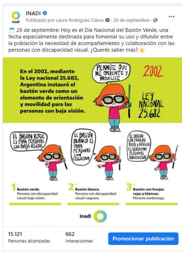
26 de Septiembre. Captura de pantalla de posteo realizado por el Día Nacional del Bastón Verde.