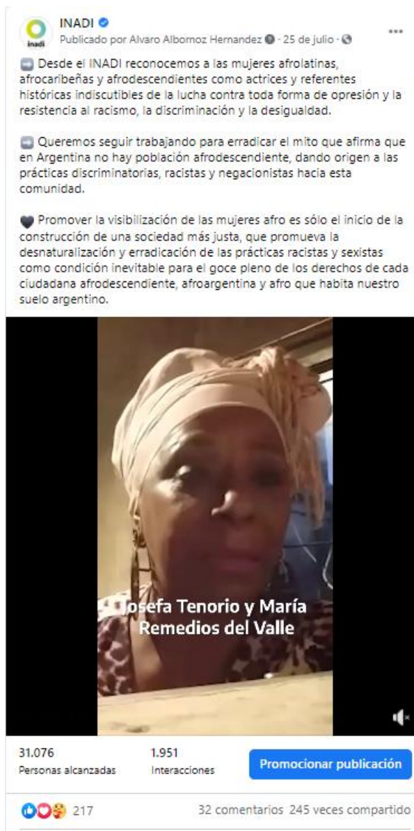
25 de Julio. Captura de posteo realizado para el Día de la Mujer Afrolatina, Afrocaribeña y de la Diáspora.