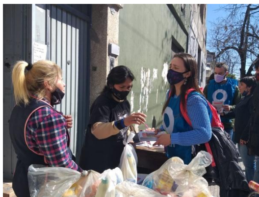
15 de Agosto, Barrio Cildañez. Entrega de refuerzo Alimentario