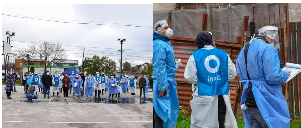
24 de Junio, Ituzaingó. Jornada Barrios sin Discriminación