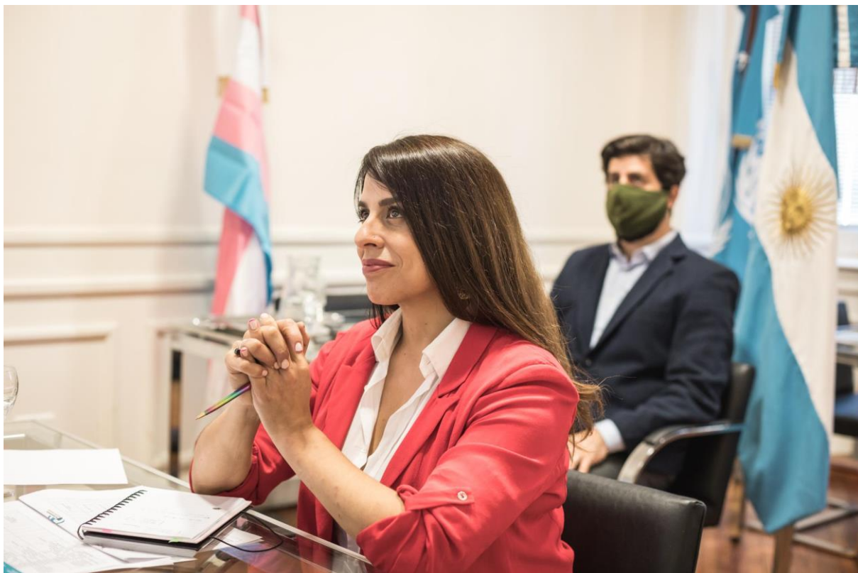
4 de Noviembre. Elección del INADI para encabezar la RIIOOD.