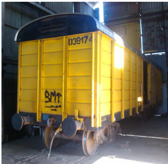
Vagón Cubiertos (Con Reforma Todo Puerta) CT-15 Trocha 1000.”