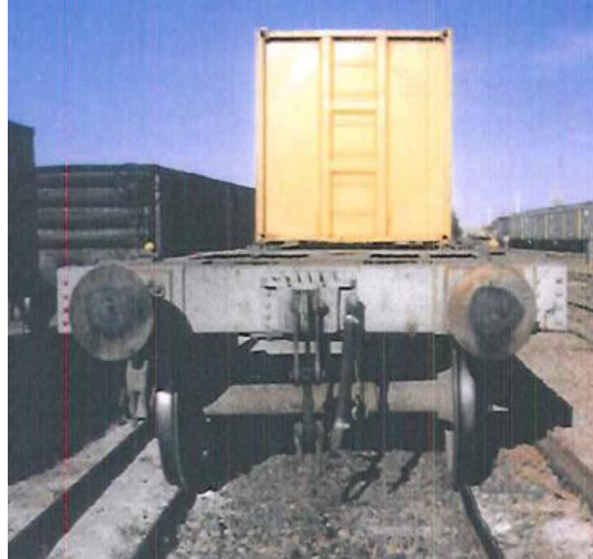
Vagón Tolva Minera CT-73 Trocha 1676