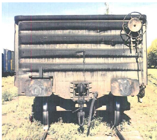
Vagón Tolva Minera CT-72 Trocha 1435