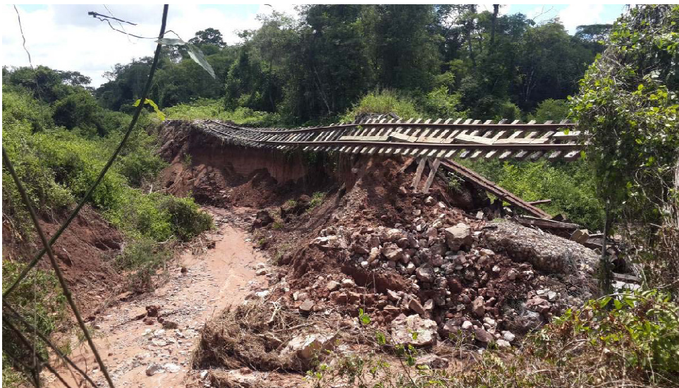
Fotografía N° 3: Tomada desde aguas arriba de la alcantarilla.