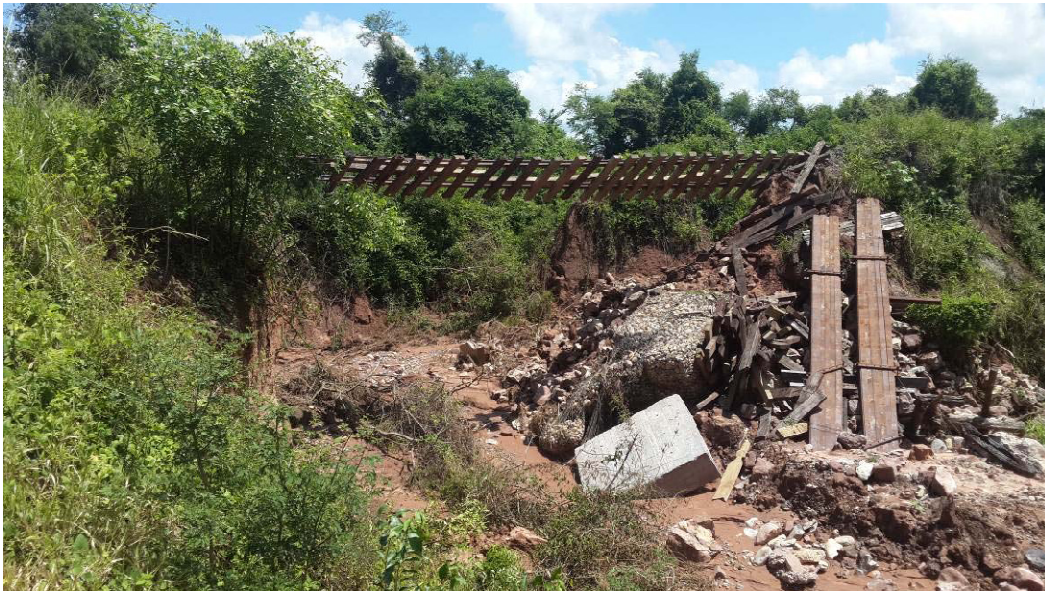
Fotografía N° 2: Tomada desde aguas abajo de la alcantarilla.

La obra se encuentra ubicada en la provincia de Salta, en el corredor que une las estaciones de Perico y Pichanal, correspondiente al Ramal C15. A partir del colapso de la alcantarilla original, se armó una alcantarilla provisoria de 10m de luz con pilastra de durmientes y paquetes de rieles, la cual colapsó con la última crecida. El terraplén posee una altura aproximada de 6m. La estructura de vía consta de durmientes de Quebracho Blanco y Colorado de 0,12m x 0,24m x 2,00m, fijación rígida con tirafondos tipo A0, rieles del tipo 42,16 kg/m de 36m de longitud, unidas con eclisas.