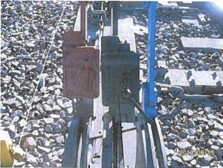
↓ Caja annett y llave subsidiaria.

1) Cuando se lleva la palanca negra al otro extremo para invertir la posición de las agujas, se saca la llave subsidiaria de la caja 'negra' haciendo medio giro y baja la lengüeta que traba la palanca negra, luego se va hasta la palanca (en este caso para cerrar la trampa), se coloca la llave en la caja de la palanca de la trampa y se la cierra para poder entrar el tren.