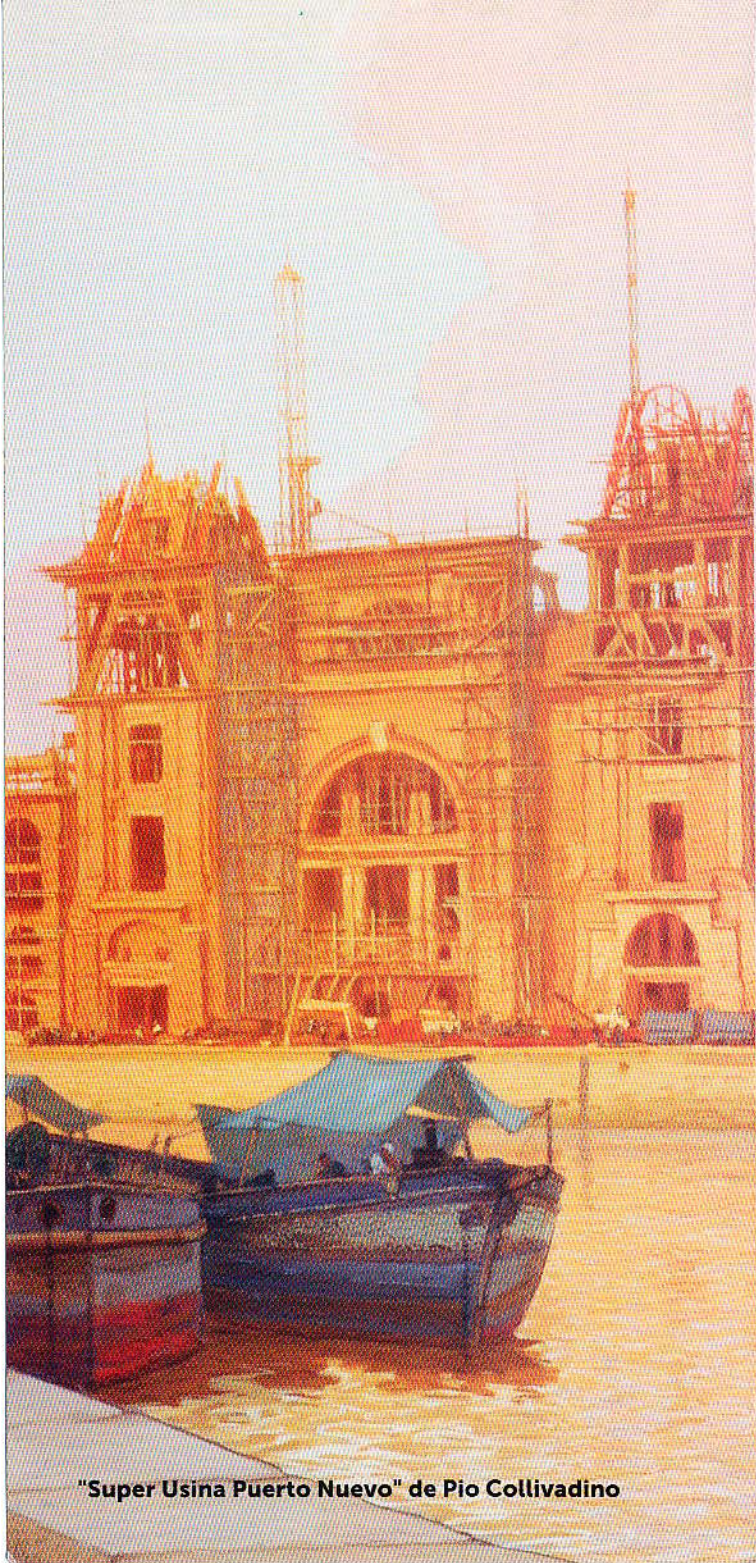
"Super Usina Puerto Nuevo" de Pio Collivadino

Para ingresar en el universo patrimonial del Palacio de Hacienda es importante señalar que la política sobre la incorporación, fomento y salvaguardia del patrimonio cultural forma parte de su piedra angular desde su concepción en 1939. Fue en aquel contexto donde distintos artistas fueron convocados para plasmar paneaux, esculturas y distintas obras que pretendían contar en imágenes aquellas situaciones, pensamientos y miradas acerca de la economía.