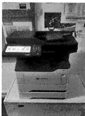
DIRECCIÓN DE GESTIÓN DOCUMENTAL