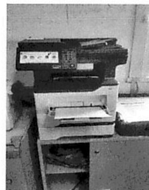
DIR. GRAL. RRHH