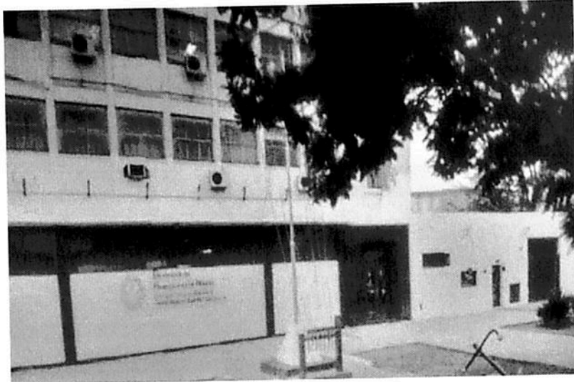
INGRESO AL SERVICIO HIDROGRÁFICO NAVAL