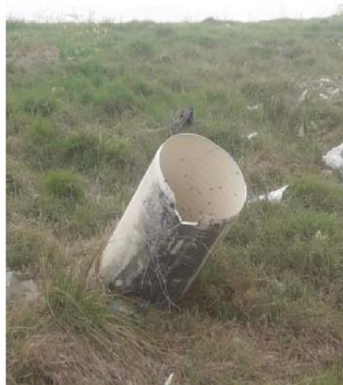
Torre para extracción de lixiviados de la celda N°1 (fuera de funcionamiento).

En un futuro se pretende realizar el mismo procedimiento, enviando el lixiviado hacia una planta de tratamiento.