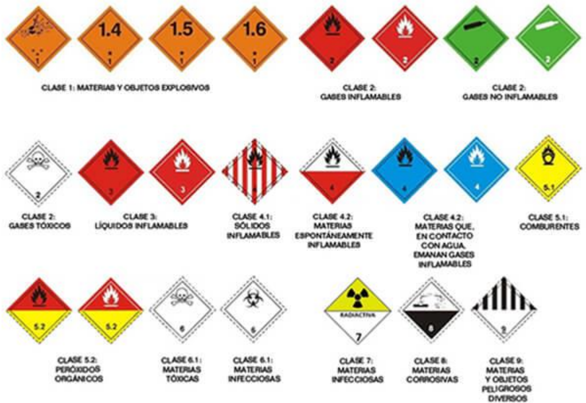
“IMÁGENES MERAMENTE ILUSTRATIVAS”