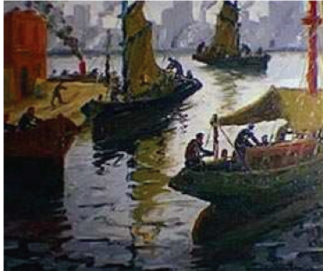
Riachuelo o Regreso de la pesca