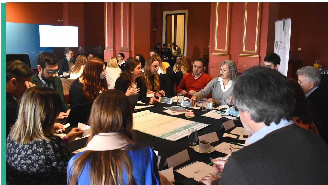
Reunión con representantes de Organizaciones de la Sociedad Civil. Salón de los Pueblos Originarios de la Casa Rosada, 23 de agosto de 2023.