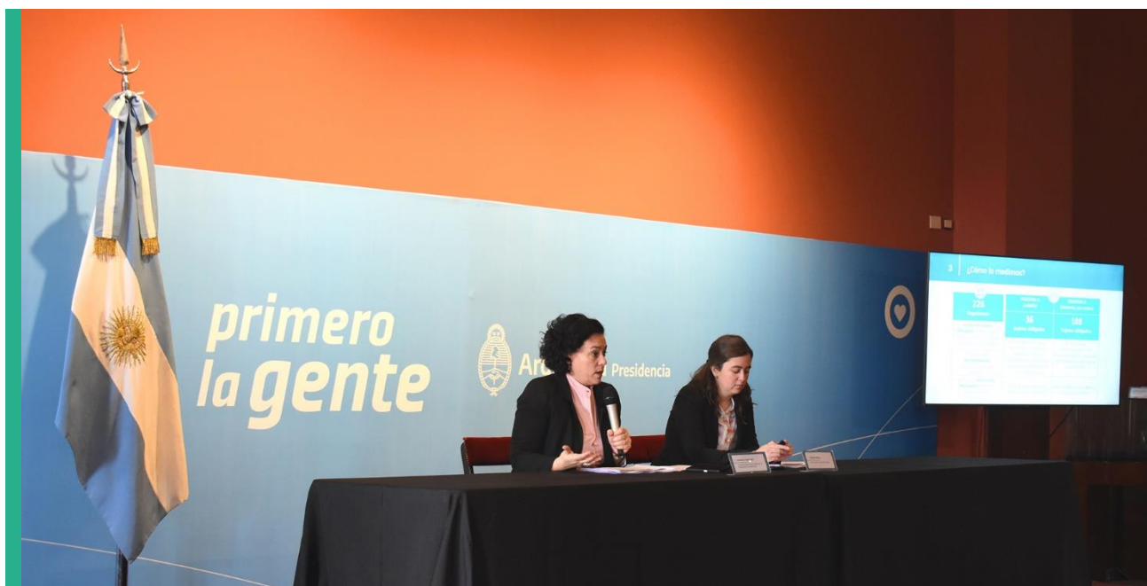
Reunión con representantes de Organizaciones de la Sociedad Civil. Salón de los Pueblos Originarios de la Casa Rosada, 23 de agosto de 2023.