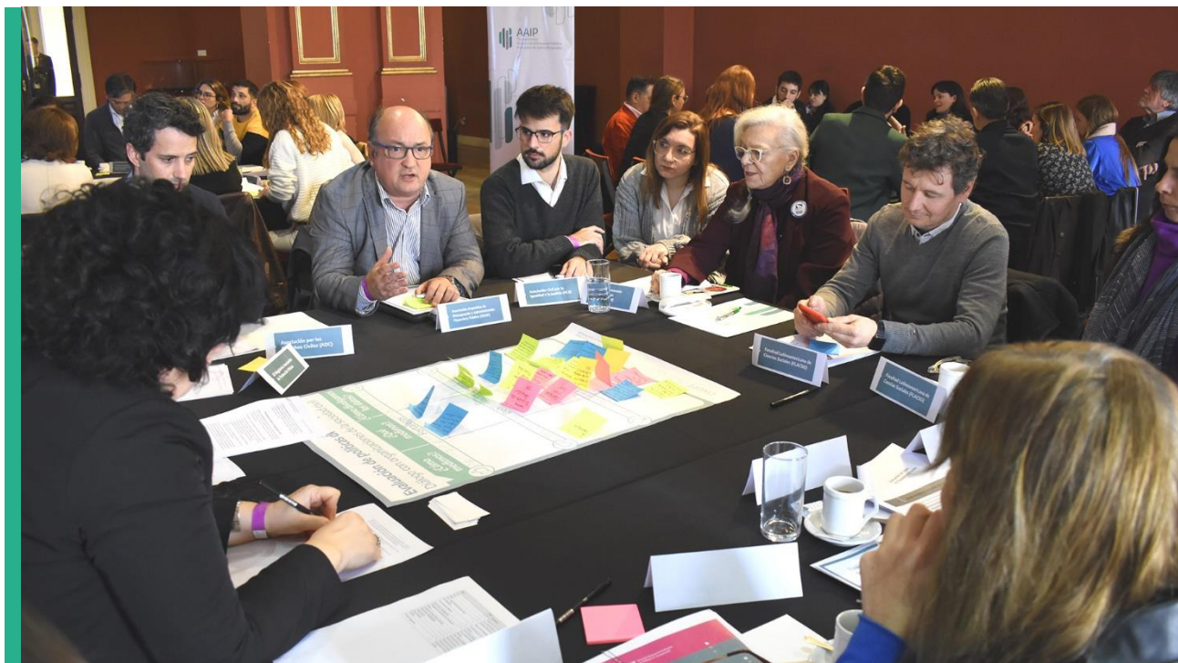
Reunión con representantes de Organizaciones de la Sociedad Civil. Salón de los Pueblos Originarios de la Casa Rosada, 23 de agosto de 2023.