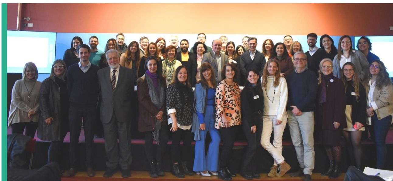
Reunión con representantes de Organizaciones de la Sociedad Civil. Salón de los Pueblos Originarios de la Casa Rosada, 23 de agosto de 2023.

La sociedad civil es un actor relevante en el diseño e implementación de las políticas de transparencia. Por ello, esta evaluación se pensó y ejecutó de manera participativa con la finalidad de contribuir a la reconfiguración metodológica del Índice de Transparencia Activa que será presentada en el último informe de este proceso.