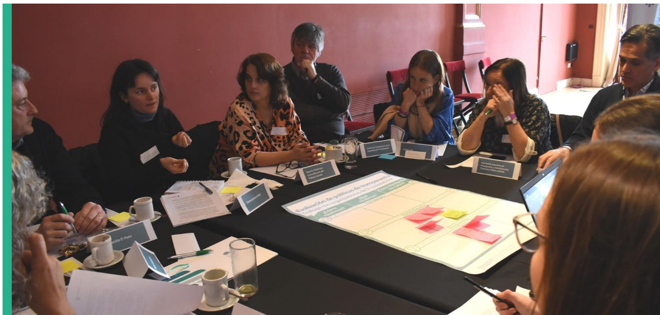
Reunión con representantes de Organizaciones de la Sociedad Civil. Salón de los Pueblos Originarios de la Casa Rosada, 23 de agosto de 2023.

A nivel de divulgación de datos, no sólo para el índice sino también con la información general brindada por el Estado, hubo cierto consenso en proponer que haya una centralización de la información, pero una descentralización de la divulgación (incorporando las voces de la sociedad civil en la divulgación para paliar la dificultad de acceso a los datos). De esta manera, se reduce la opacidad y se promueve un mayor compromiso en la publicidad, comunicación y sensibilidad del índice y de la Ley 27.275, comenzando con una mayor visibilidad del botón del ITA en el sitio de la Agencia, y consecuentemente en el nuevo portal de transparencia. En sus palabras: