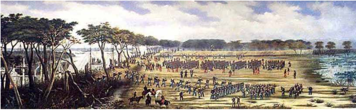
Desembarco de tropas aliadas (c.1860)