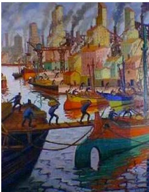
Elevadores a pleno sol.

492- A principios del siglo xx, la zona sur de Buenos Aires estaba compuesta por barrios de clase trabajadora inmigrante vinculada a las labores del puerto y al incipiente desarrollo industrial. En ese contexto se desarrolló un movimiento cultural alrededor de instituciones como el Ateneo Cultural o la Asociación Impulso . A continuación, se muestran dos obras de uno de los pintores que mejor representó los paisajes portuarios de esa época, utilizando como técnica el uso de la espátula. ¿Quién de los autores consignados a continuación fue el autor de estas obras?