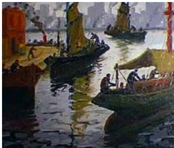
Riachuelo o Regreso de la pesca