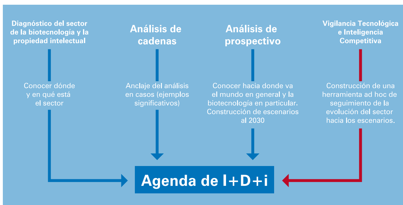
Figura A.1: Componentes principales y esquema de trabajo del Proyecto Prospectiva Biotecnología Argentina 2030

El enfoque metodológico propuesto, en lo general, se organizó de acuerdo a cuatro componentes centrales: el diagnóstico (sobre las capacidades nacionales y los sistemas de propiedad intelectual), el análisis prospectivo, y el diseño y puesta en marcha de un sistema de Vigilancia Tecnológica e Inteligencia Competitiva (VTelC). De manera transversal a estos tres ejes se abordó también el análisis de cadenas de valor prioritarias del sector biotecnológico. Estos productos tuvieron por finalidad construir la información de base para el desarrollo de una agenda de investigación, desarrollo e innovación (Ag. I+D+i) que, dado el escenario descrito en el diagnóstico, permita aprovechar las oportunidades de los escenarios resultantes del componente prospectivo. Por su parte, el sistema de VTelC es un mecanismo de acompañamiento a las políticas a implementar y como generador de información para la realización de los ajustes requeridos según la evolución de los escenarios identificados (Ver Figura A.1).