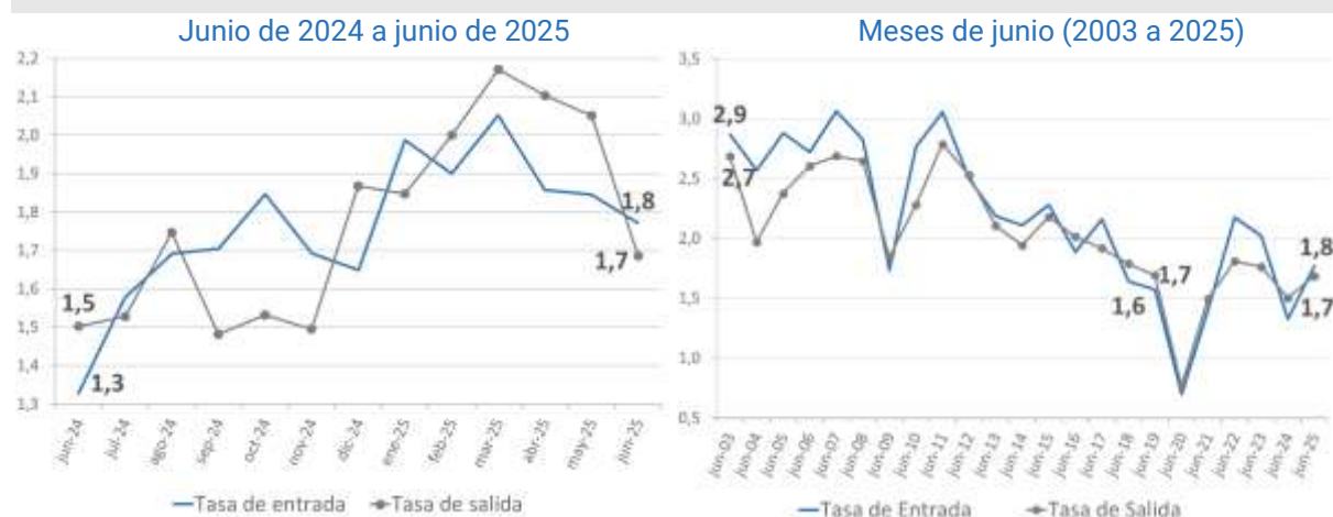
Gráfico 2. Tasas de entrada y salida. Total aglomerados relevados.