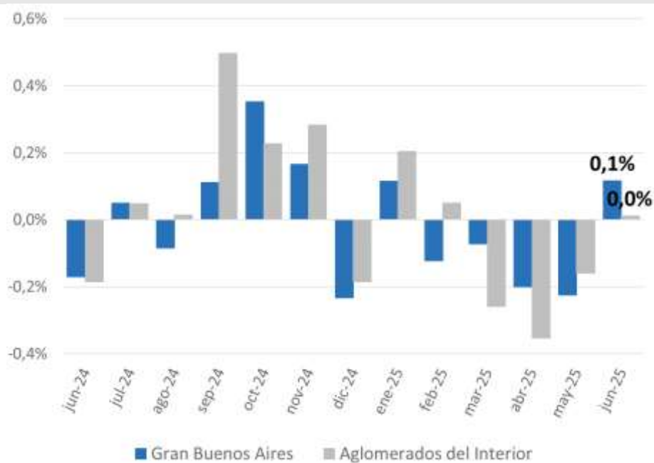
Gráfico 7. Variación del empleo en GBA y aglomerados del Interior. Empresas de 10 o más personas ocupadas. Junio de 2024 a junio de 2025.