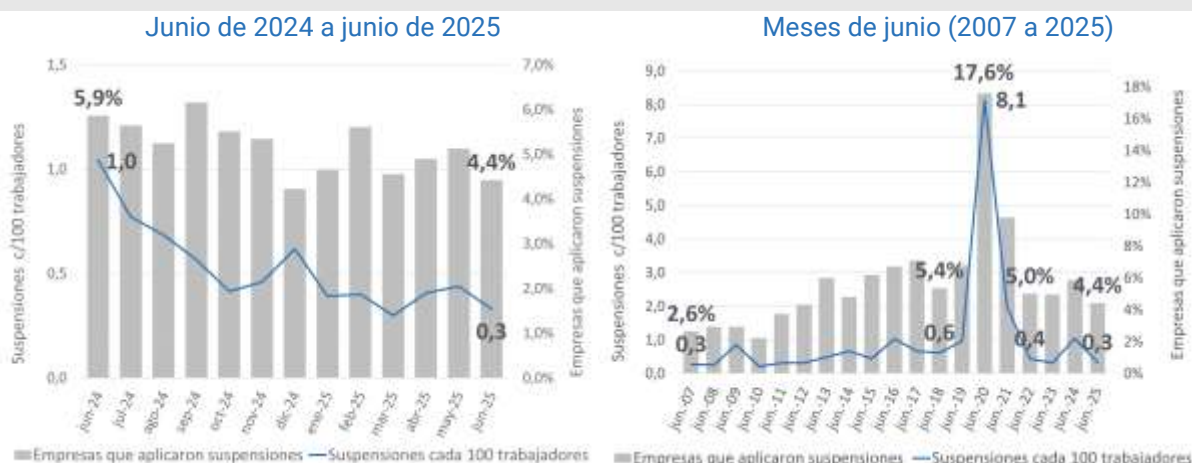
Gráfico 6. Empresas que aplicaron suspensiones y tasa de suspensiones. Total aglomerados relevados.