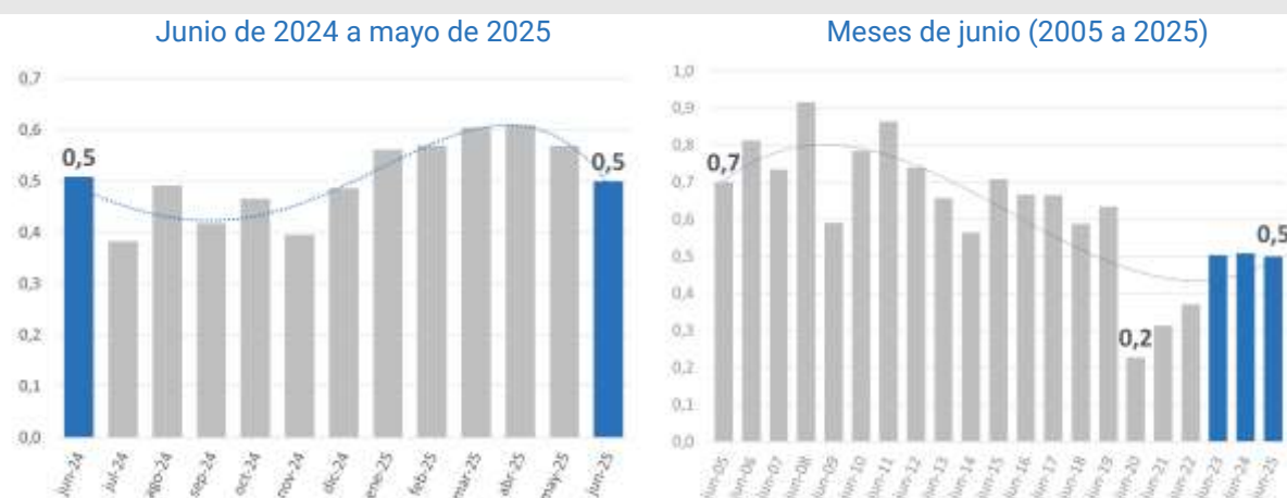
Gráfico 5. Tasa de despidos. Total aglomerados relevados.