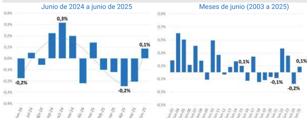
Gráfico 1. Variación mensual del empleo. Total aglomerados relevados.