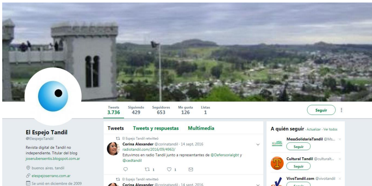
Cuenta de Twitter @EspejoTandil

De todo ello se desprende que quien firma una de las certificaciones de los espacios que puso a disposición Cimerman es empleada de la ANSES y está casada con quien habría manejado el contenido de la publicación digital “El Espejo Serrano”.