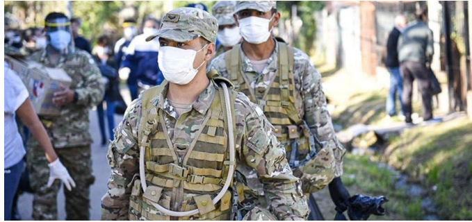
Tropas de las Fuerzas Armadas desplegadas en los Operativos Belgrano I y II en el marco de la pandemia del COVID-19.

general sanitaria, lo que representó el despliegue de tropas más grande después de la Guerra de Malvinas, con presencia en todo el país.