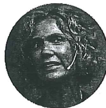
Maru Botana Cocinera y empresaria