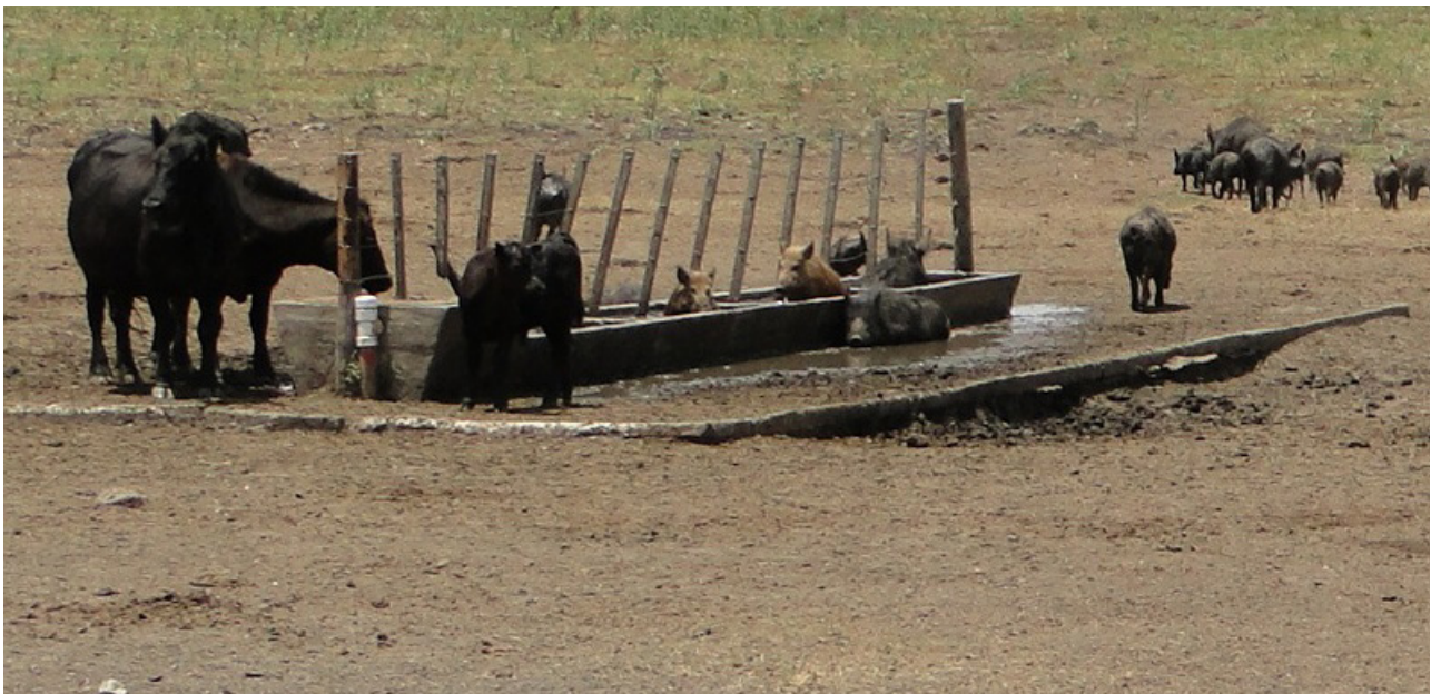
Foto: Cerdos cimarrones interactuando con el ganado bovino en la Bahía de Samborombón.

El jabalí o cerdo silvestre es posiblemente la especie de la fauna con mayor relevancia sanitaria para la salud del hombre y de los animales domésticos. Ello se debe a su amplia distribución geográfica y su abundancia creciente, pero sobre todo al hecho de tratarse del pariente silvestre o asilvestrado del cerdo doméstico, y de una especie cuya carne es aprovechada para el consumo. Es ampliamente reconocido que las poblaciones de cerdos silvestres actúan como reservorios altamente móviles de una serie de enfermedades transmisibles al hombre y a los animales domésticos. Entre las enfermedades más comúnmente encontradas en poblaciones de cerdos silvestres se encuentra la brucelosis porcina (Giovannini et al. , 1988; Van Der Leek et al. , 1993a), pseudorabia (Van Der Leek et al. , 1993b; Zupancic et al. , 2002), Peste Porcina Clásica (Zupancic et al. , 2002), triquinosis, enfermedad de Aujeszky y tuberculosis.