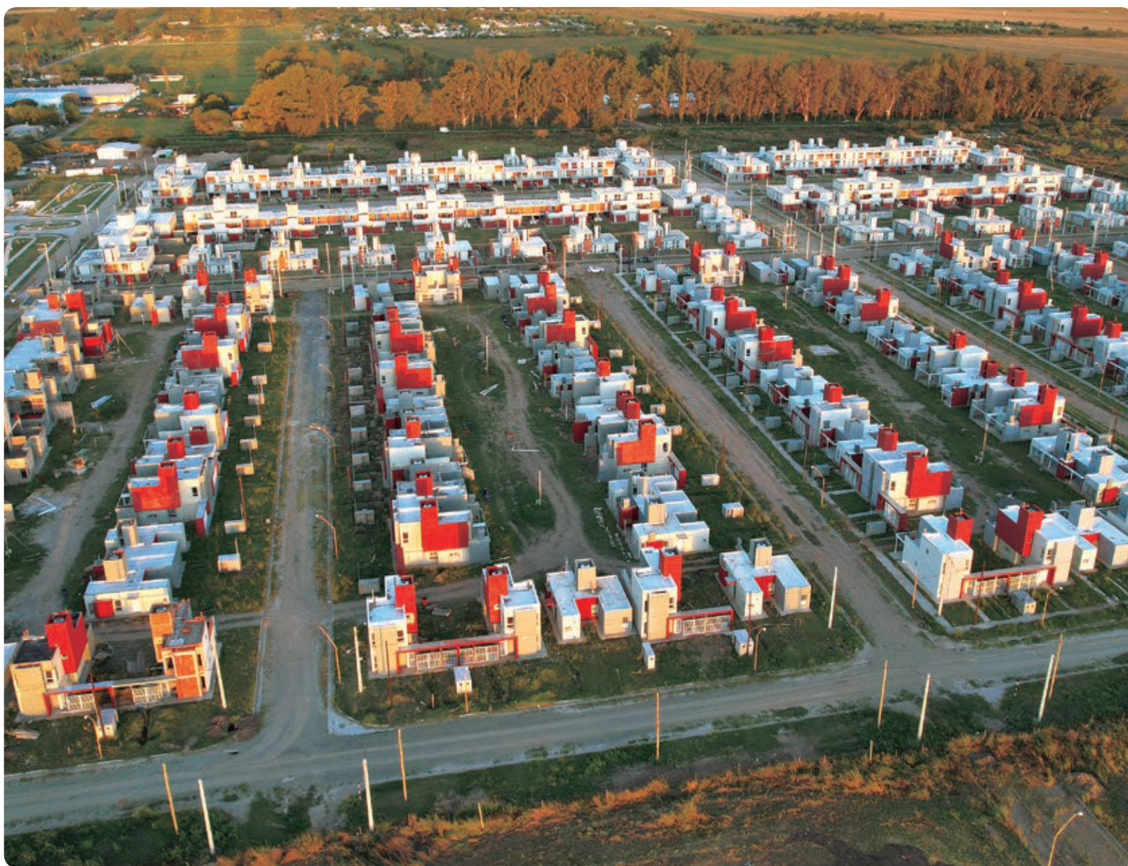
Desarrollo Urbanístico San Francisco, Provincia de Córdoba.

El presidente Alberto Fernández entregó 300 viviendas del Programa Federal Casa Propia en Villa Mercedes, San Luis, con las que se alcanzaron las 70.000 viviendas otorgadas en todo el país desde el inicio de la gestión. En la actualidad hay 140.000 hogares más en ejecución en todo el territorio nacional.