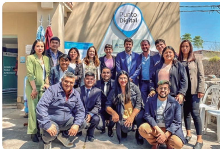
Punto Digital Chicoana, Provincia de Salta

Podés encontrar tu Punto Digital más cercano en el mapa interactivo disponible en: puntodigital.gob.ar