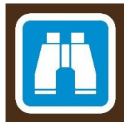
Avistamiento de fauna / flora