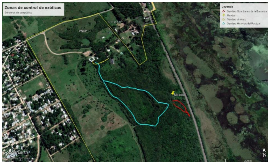
Figura 2: Senderos: en amarillo el Sendero Recuperando lo Nuestro (vivero), en celeste el Sendero Historias del Pastizal, en rojo el Sendero Guardianes de la Barranca.

En cuanto a la asistencia en la toma de datos, el sector será el acorde dentro del Parque para el monitoreo de la especie.