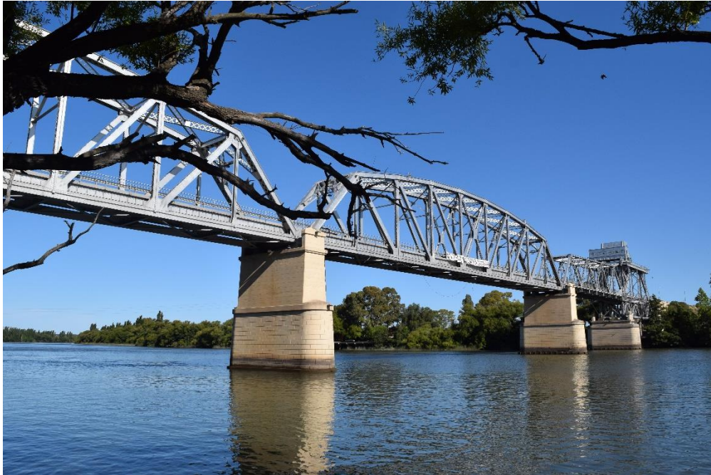
Foto 7 – Centro histórico, Rancho Rial, Monumento Histórico Nacional