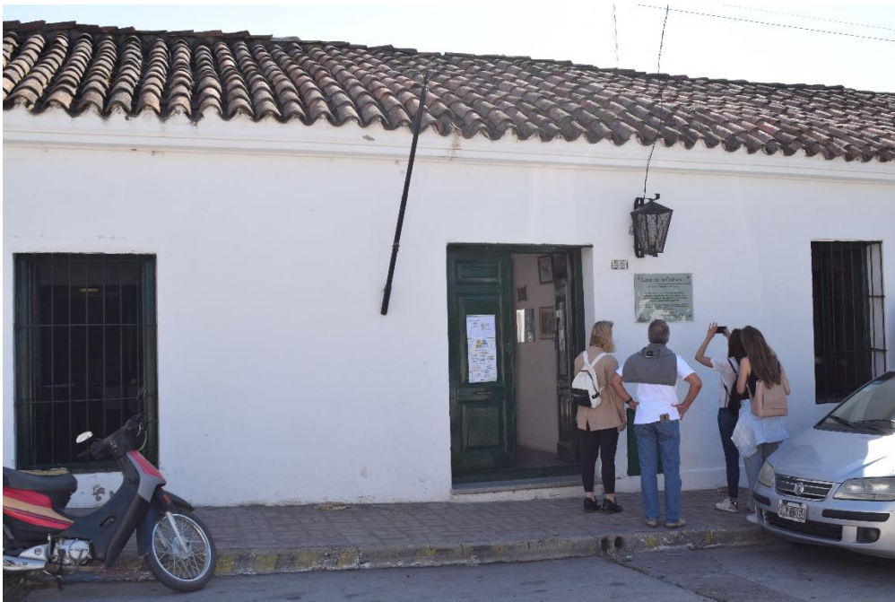
Foto 8 – Centro histórico, Rancho La Carlota, Monumento Histórico Nacional