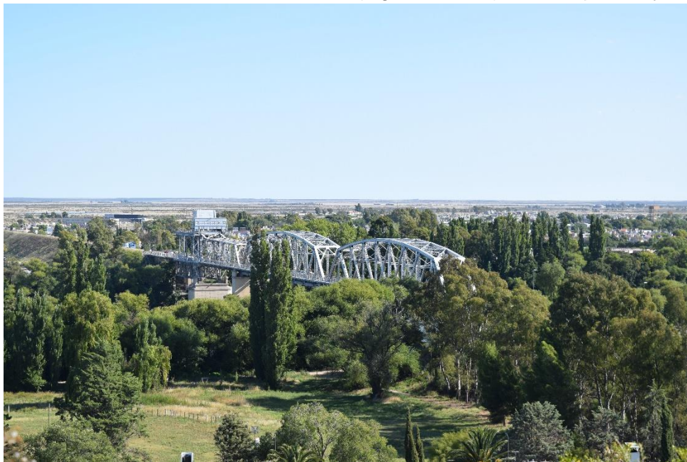
Foto 5 – El paisaje ribereño, dentro del ejido urbano, luego del centro histórico