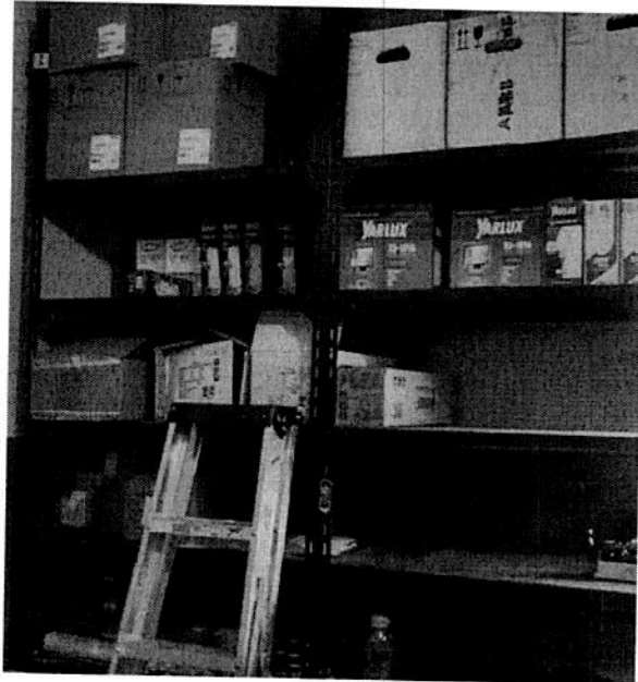
Productos de iluminación