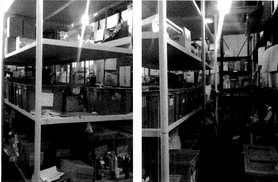
Estanterías con productos y componentes eléctricos

Ministerio de Defensa Unidad de Auditoría Interna