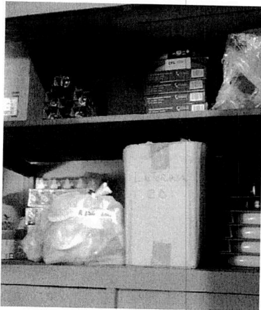
Balastos, zócalos, conectores y oiales eléctricos