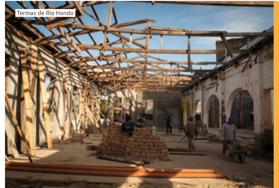
Termas de Río Hondo