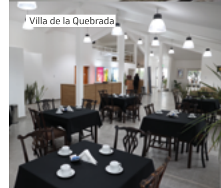
Villa de la Quebrada