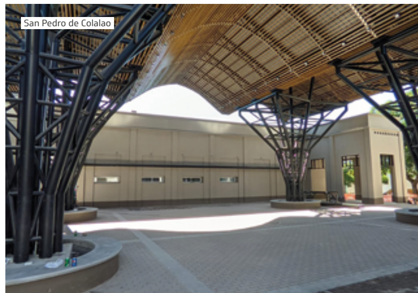
San Pedro de Colalao