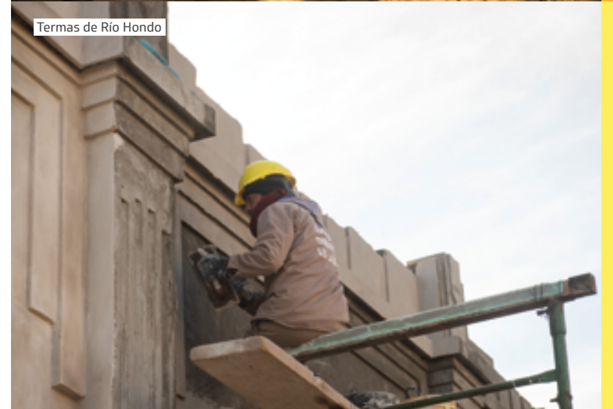
Termas de Río Hondo