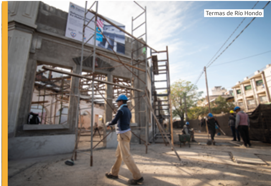
Termas de Río Hondo