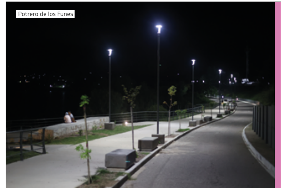
Potrero de los Funes