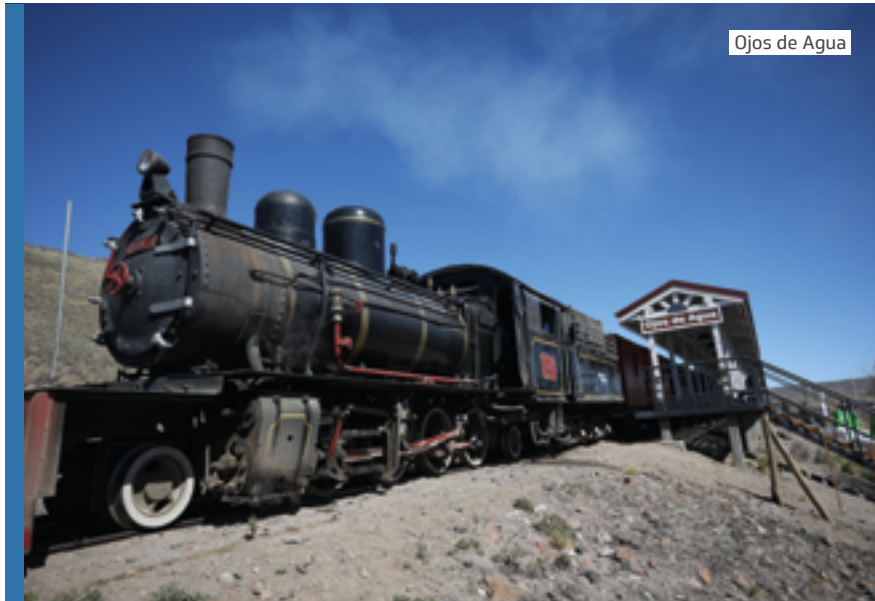
Ojos de Agua