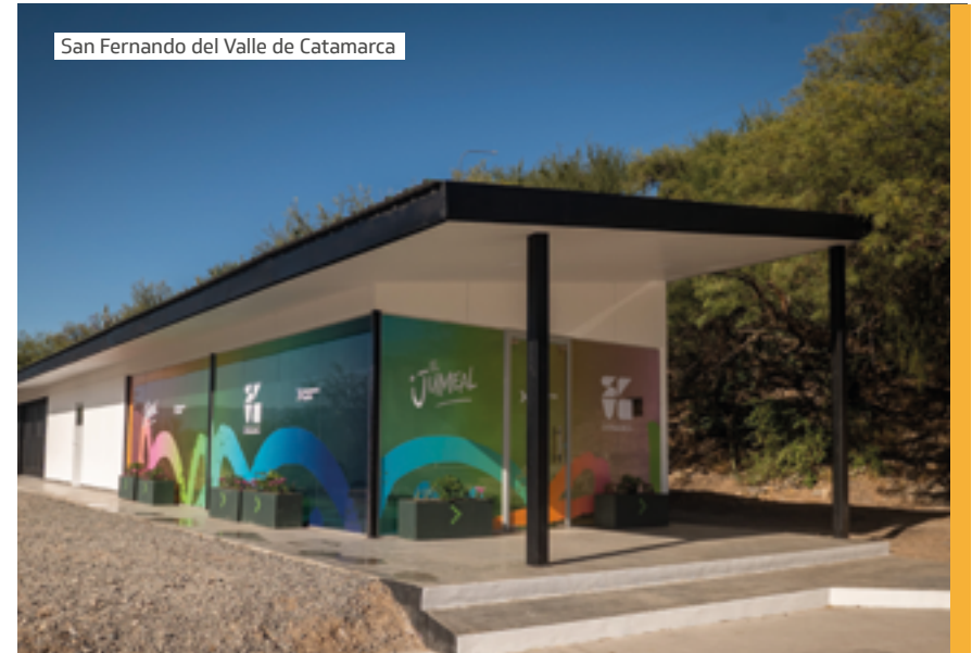
San Fernando del Valle de Catamarca