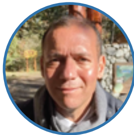
Omar Gutiérrez Gobernador Provincia del Neuquén

“Con este programa se consolidan nuevos destinos para el desarrollo turístico de la provincia con eje en la integración y en la accesibilidad.”