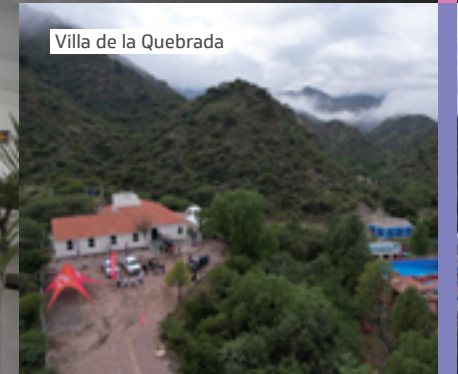
Villa de la Quebrada