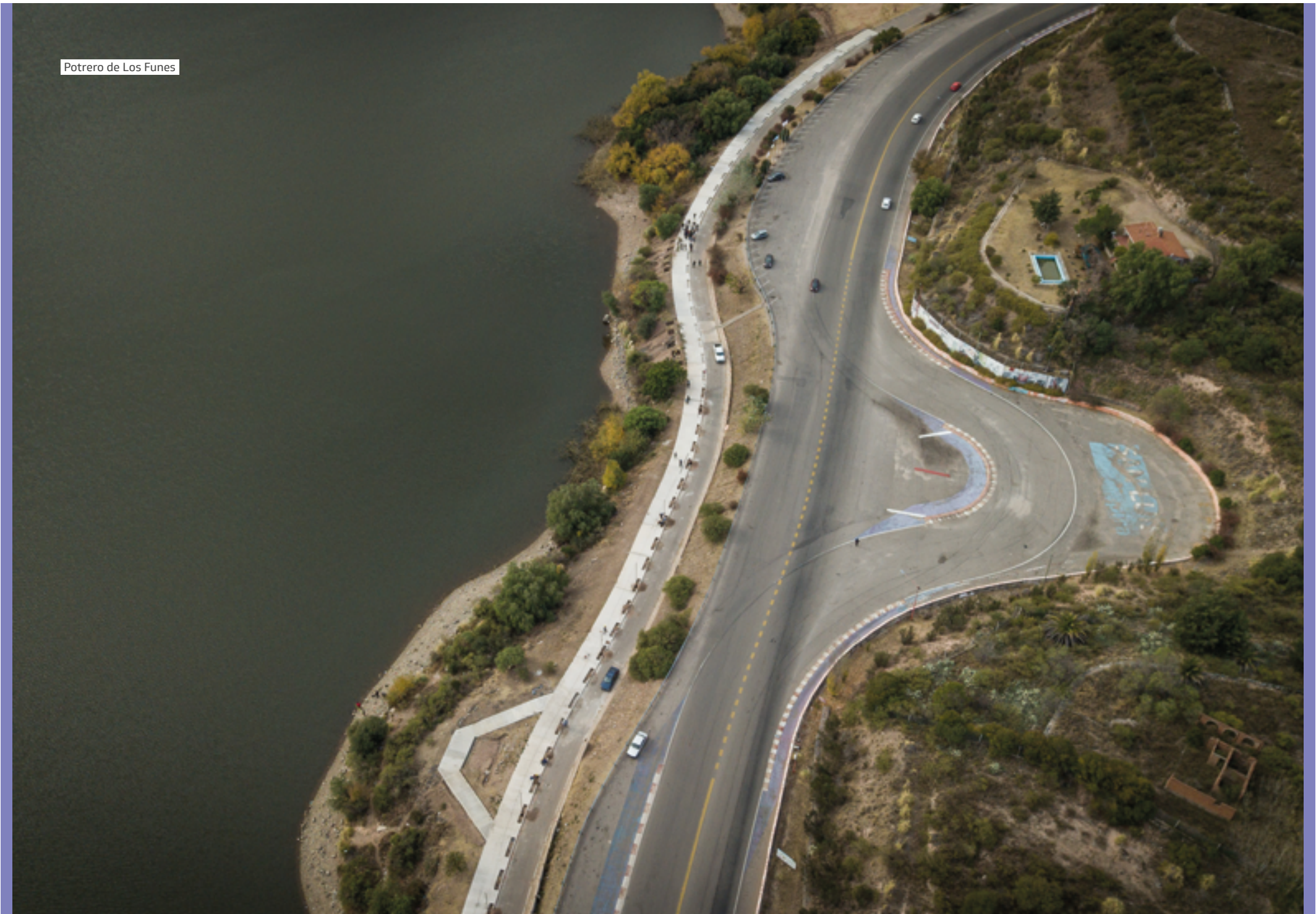
Potrero de Los Funes