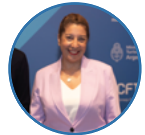
Arabela Carreras Gobernadora Provincia de Río Negro

“Estas obras de infraestructura turística permiten que destinos emergentes de la provincia puedan desarrollar sus atractivos principales.”