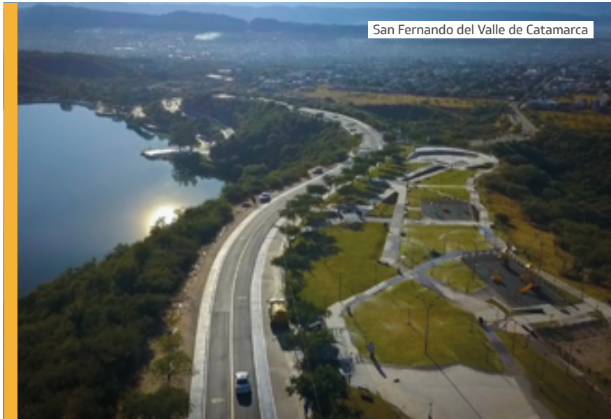
San Fernando del Valle de Catamarca