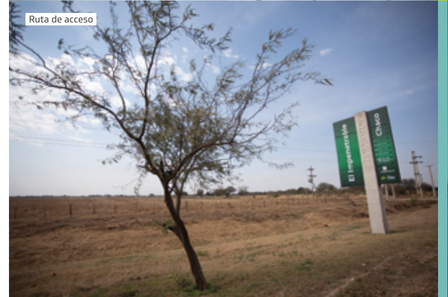
Ruta de acceso