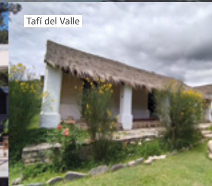
Tafí del Valle