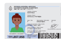
Nuevo DNI digital