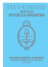
DNI (libreta celeste)