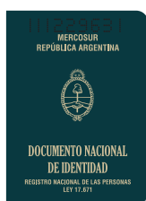
DNI (libreta verde)