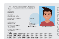
DNI tarjeta (del DNI libreta celeste)