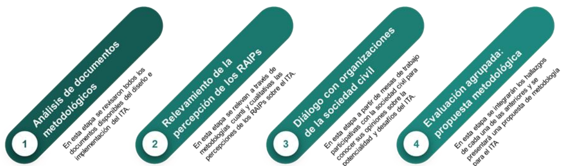
Figura 1 - Estrategia de evaluación agrupada del Índice de Transparencia Activa