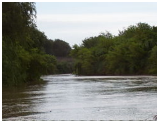
El río Cuarto en las proximidades de la ciudad La Carlota

El río Cuarto recibe las aguas del Piedra Blanca y sigue hacia el este donde por margen izquierda recibe las aguas del San Bartolo y de las Barrancas. Luego de la confluencia con el río de las Barrancas se inclina al sudeste pasando por la localidad de Río Cuarto, ubicada sobre su margen derecha. Hasta la próxima localidad, La Carlota, sigue corre en dirección oeste-este. Quince kilómetros aguas debajo de la localidad de La Carlota dobla al noreste donde empieza a formarse la laguna Los Olmos que se transforman en bañados (aproximadamente 60 Km) tras el ensanchamiento del cauce y por la escasa pendiente. Luego de este recorrido toma el nombre de Saladillo que mantiene su nombre hasta la desembocadura en el río Tercero. Desde la confluencia con el río de Las Barrancas hasta el pueblo de Saladillo el río Cuarto recorrió 300 Km.