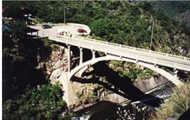
Puente de la ruta provincial 5 sobre el río Tercero

último, entre los ríos importantes que conforman el río Tercero se encuentra el río de las Letanías que recibe las aguas de los arroyos de las Ensenadas y del Paso Cercado. Cerca del Rincón de Luna se une al río Manzano. Esta unión de los cursos da origen al río Grande. Por la orilla izquierda, entonces, recibe las aguas del Durazno. Una vez que se llega al valle, se ensancha el cauce y la pendiente disminuye. El lecho se torna arenoso y se forman barrancas de pequeña elevación. Por margen derecha el río Grande recibe aguas del río Quillinzo y de la Cruz.