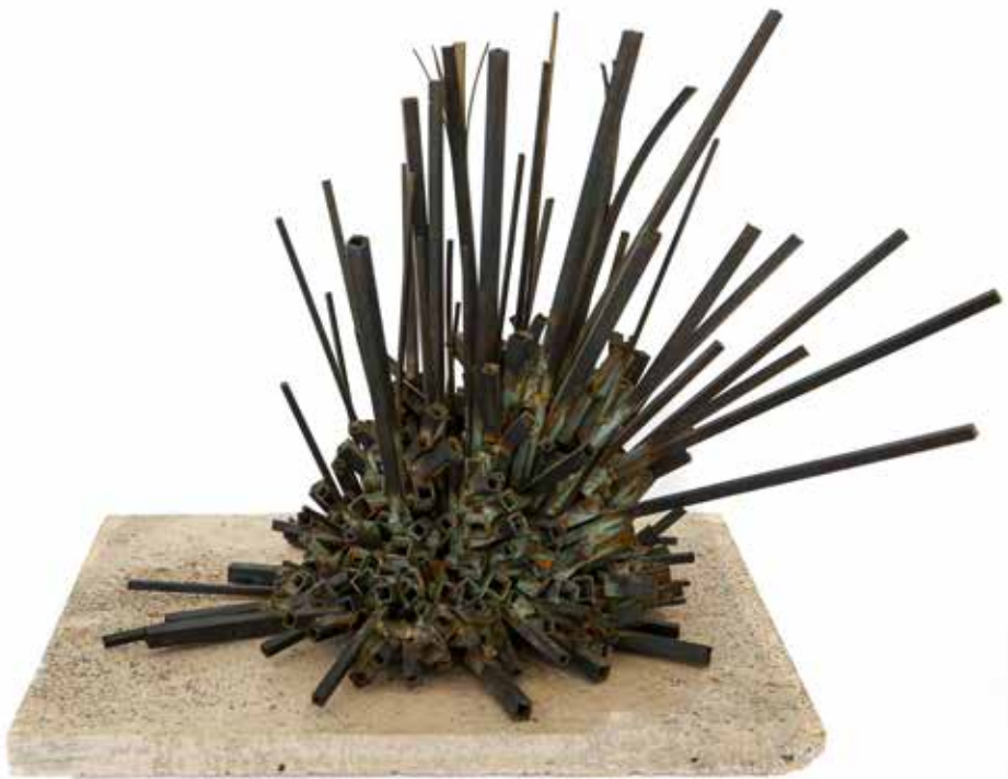
Abisal Tubos soldados de Bronce 40 x 50 x 50 cm 1988