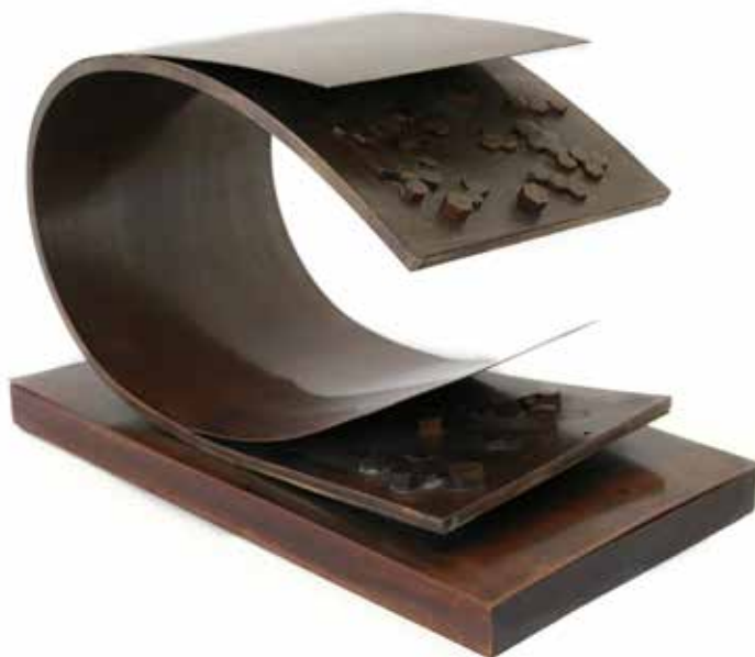
Disección III Chapa y piezas hexagonales de bronce 43 x 28 x 23 cm 1977