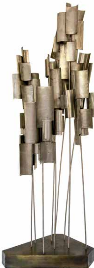
Achiras Acero inoxidable 102 x 50 x 50 cm 1970