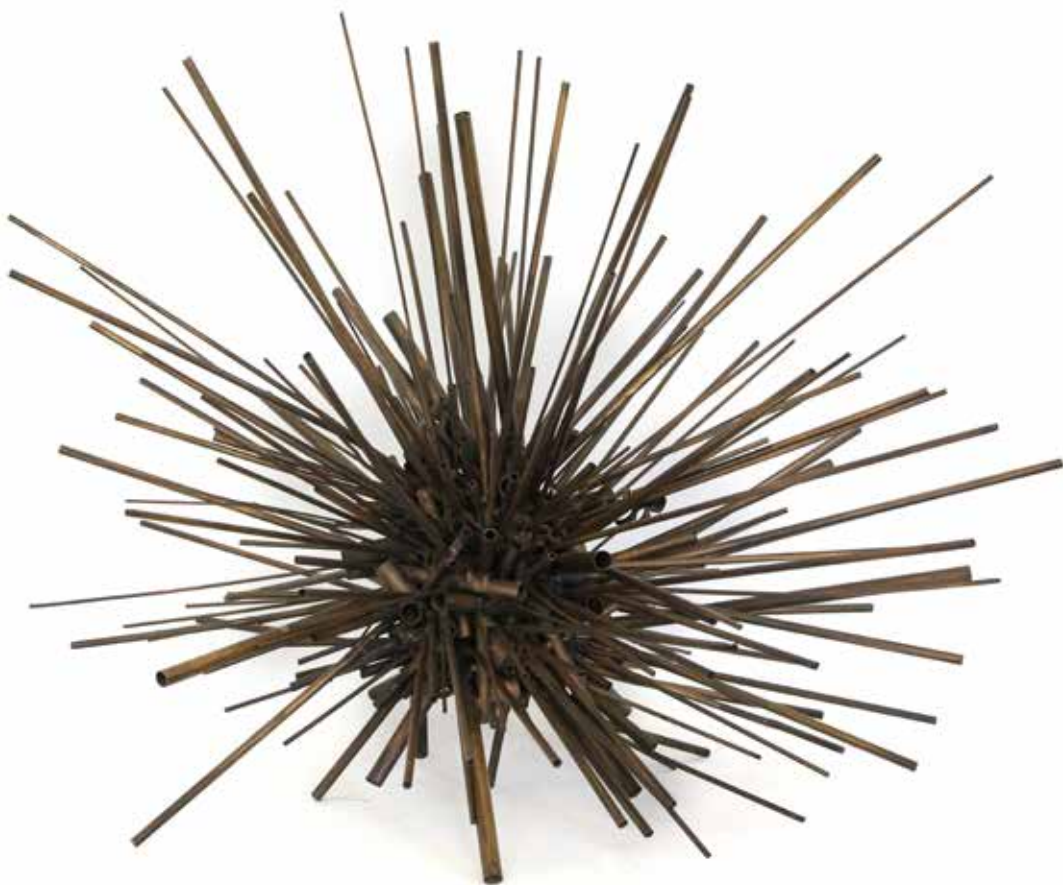
Las Pléyades Tubos de bronce soldados con plata 56 x 32 x 26 cm 1960