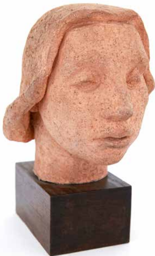
Cabeza Terracota 28 x 26 x 24 cm. 1950