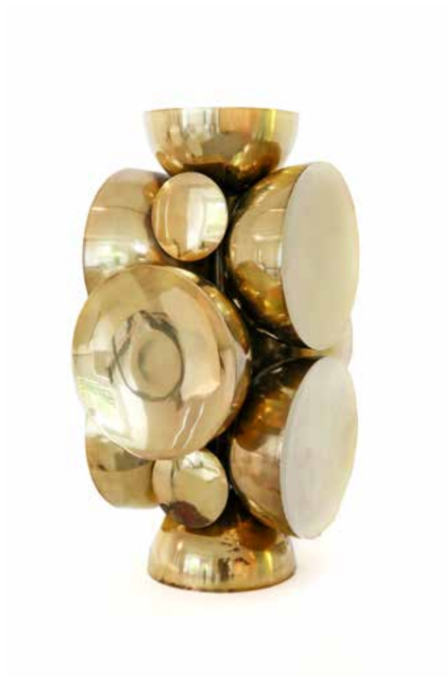
Soles y lunas Bronce 56 x 32 x 26 cm 1975