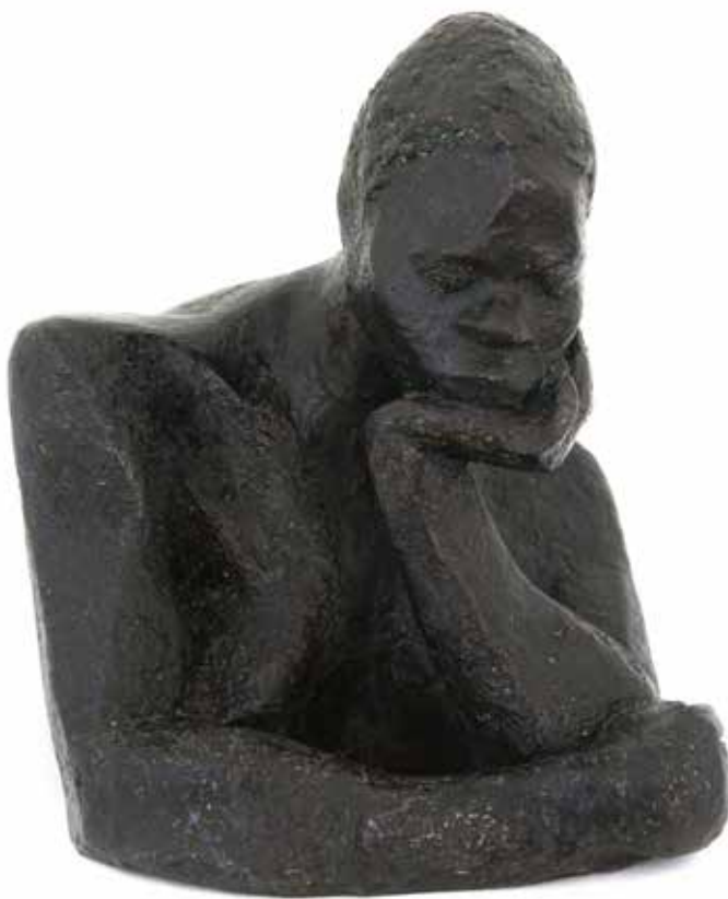
Busto de Negra Bronce fundido 35 x 31 x 26 cm 1951