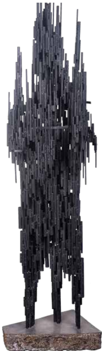
Goliath Tubos de hierro soldados 190 x 54 x 30 cm 1962