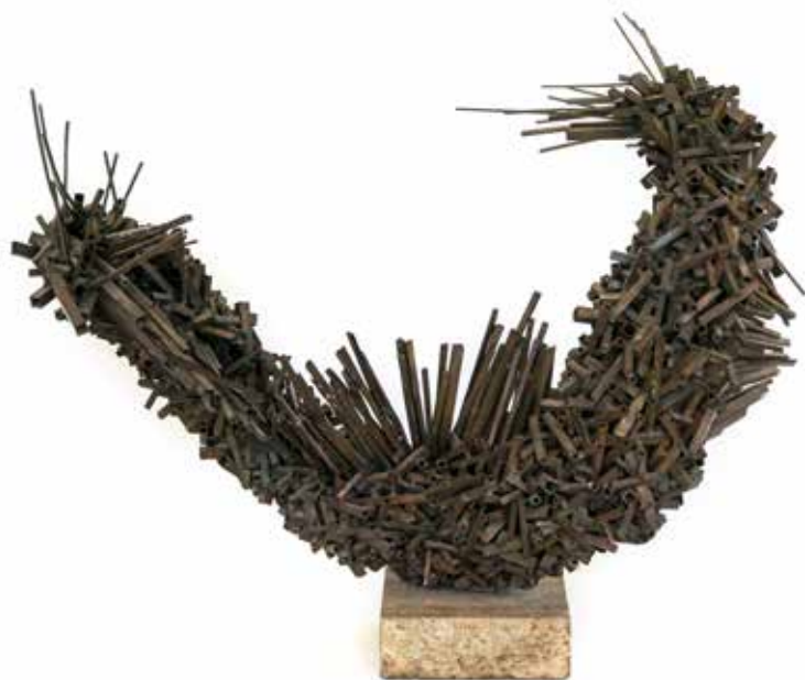
Pequeño dragón Varillas y tubos de bronce 86 x 75 x 41 cm 1962