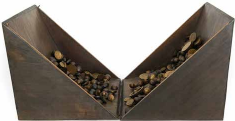
Corte Diagonal Bronze 30 x 30 x 62 cm 1972