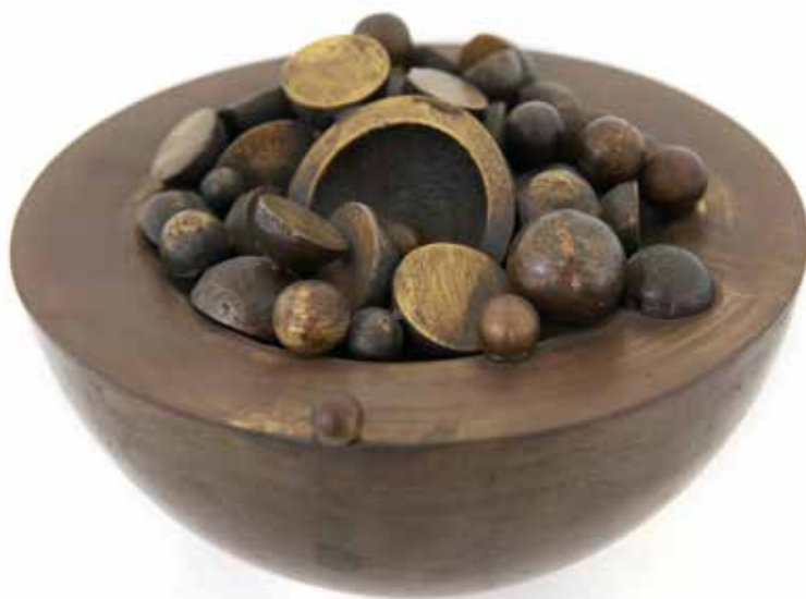
Fruto cortado Bronce 10 X 28 X 28 cm