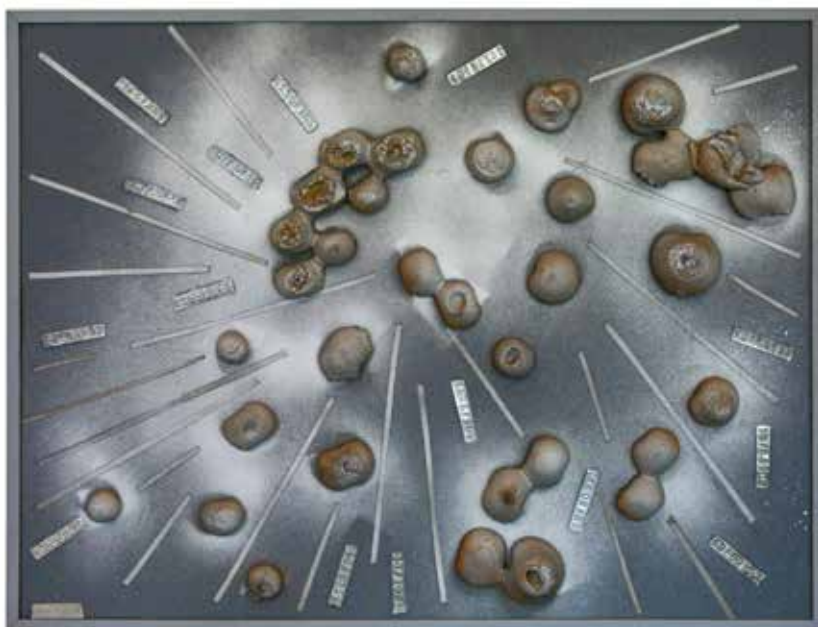
Irradiación Collage, caucho y metales 87 x 84 cm