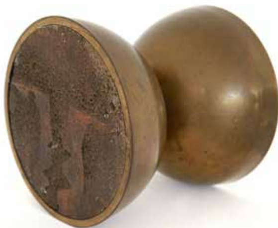
Las dos caras de la luna Bronce en chapa y fundición 21 x 22,5 x 22,5 cm 1975