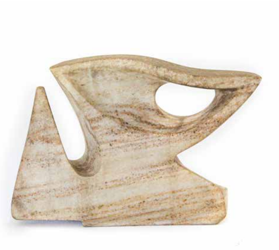
Ídolo Mármol de Córdoba 53 x 42 x 15 cm 1955