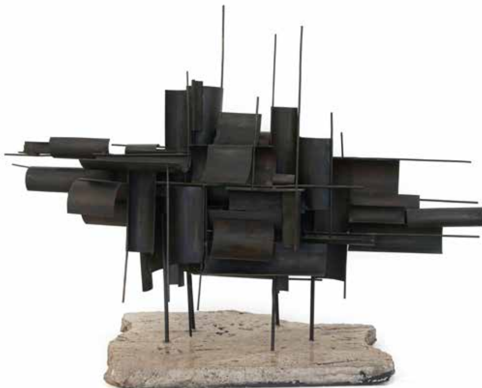
Tauronave Bronze 80 X 100 X 20 cm. 1967 c.a.