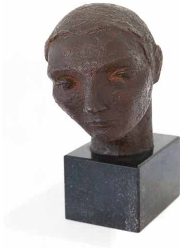
Melancolía Bronce fundido 25 x 25 x 16 cm 1951