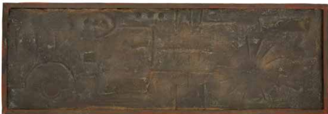
Mediodía Bronce 30 x 90 cm 1963