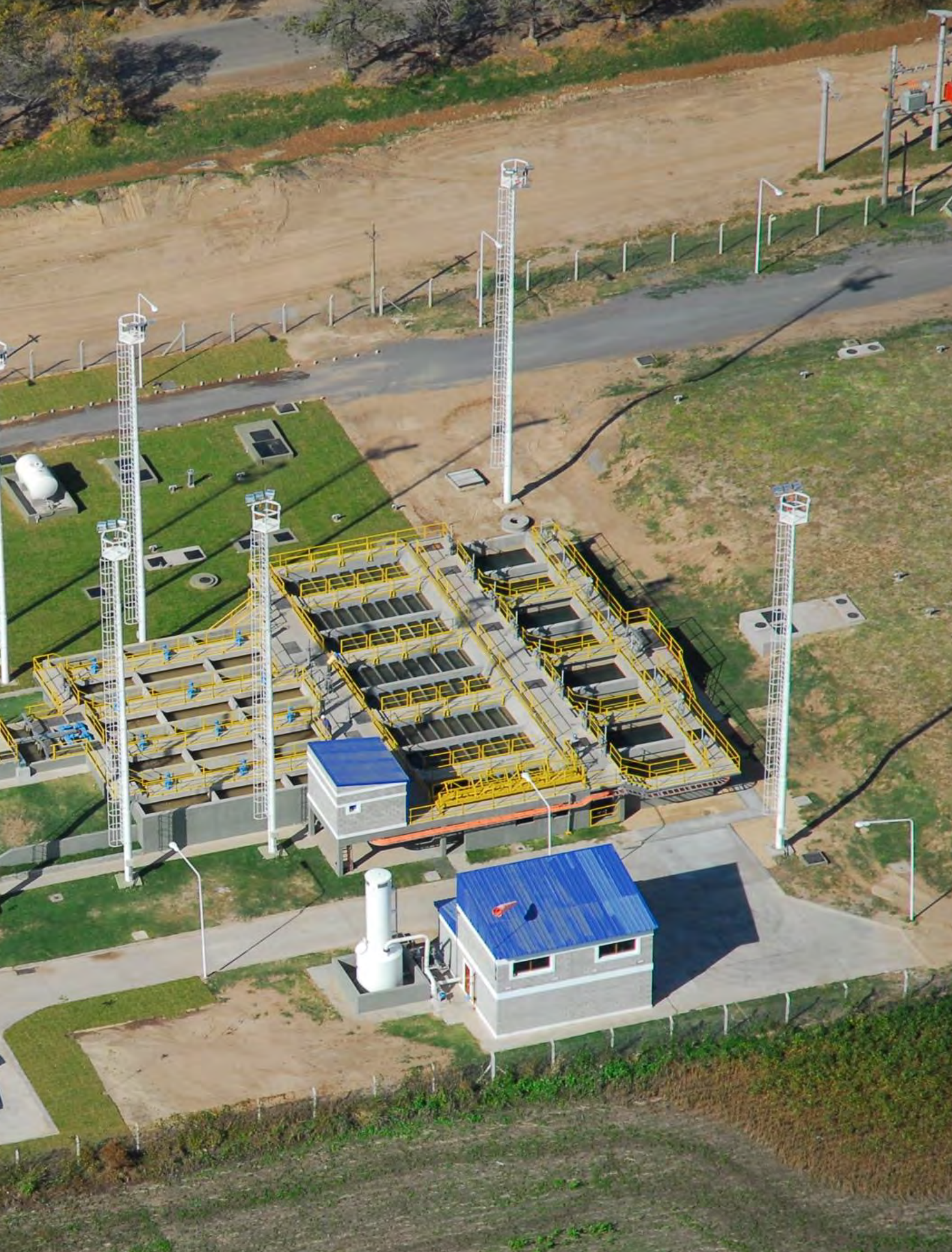
CONSTRUCCIÓN DEL ACUEDUCTO CENTRO OESTE - SANTA FÉ