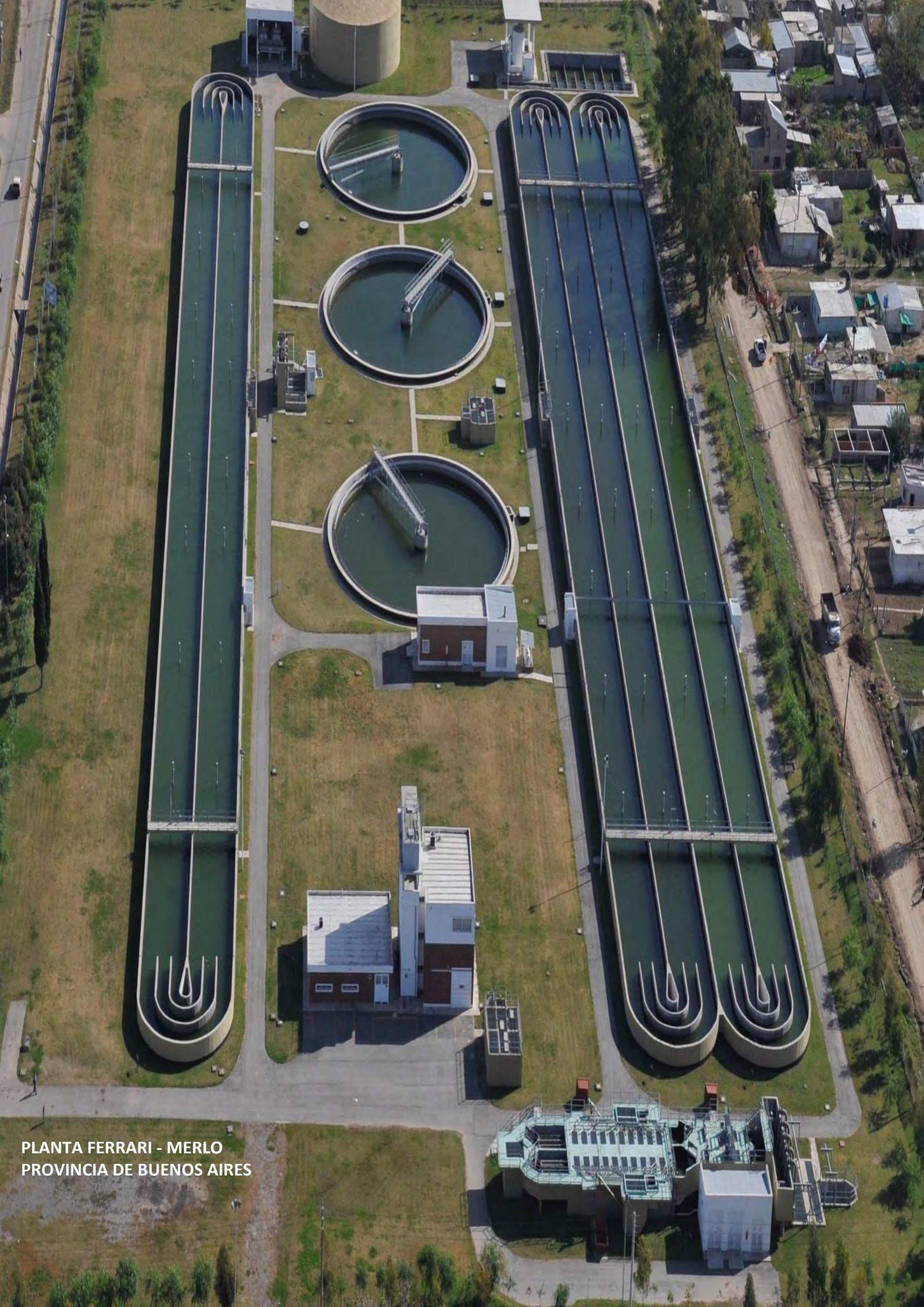
PLANTA FERRARI - MERLO PROVINCIA DE BUENOS AIRES