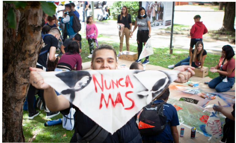
Jóvenes participan de las distintas actividades impulsadas por la SDH.

También se realizó íntegramente la serie de cortos audiovisuales “Microrrelatos. Historias breves de los juicios de lesa”, a partir de fragmentos de testimonios brindados en las distintas audiencias. El material se desarrolló como parte del contenido de la web juiciosdelesahumanidad.ar. A través de un convenio firmado con el Instituto Nacional de Cine y Artes Audiovisuales (INCAA), los 58 cortos que componen la serie se proyectaron en julio y agosto de 2022 en la previa de cada película ofrecida por el complejo de cines Gaumont. Y, desde marzo de ese mismo año, se sumaron