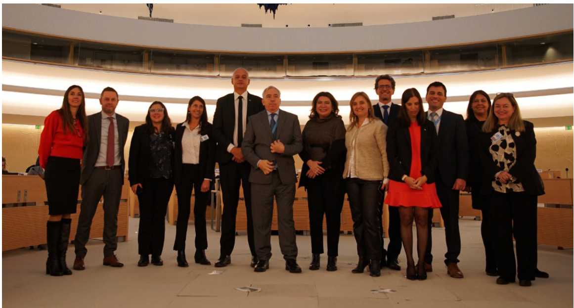
La delegación argentina que se presentó ante el Consejo de Derechos Humanos de las Naciones Unidas durante la cuarta edición del Examen Periódico Universal (EPU).

Se presentaron 8 informes integrales sobre el cumplimiento de las obligaciones del Estado argentino ante los órganos de tratados de la ONU.