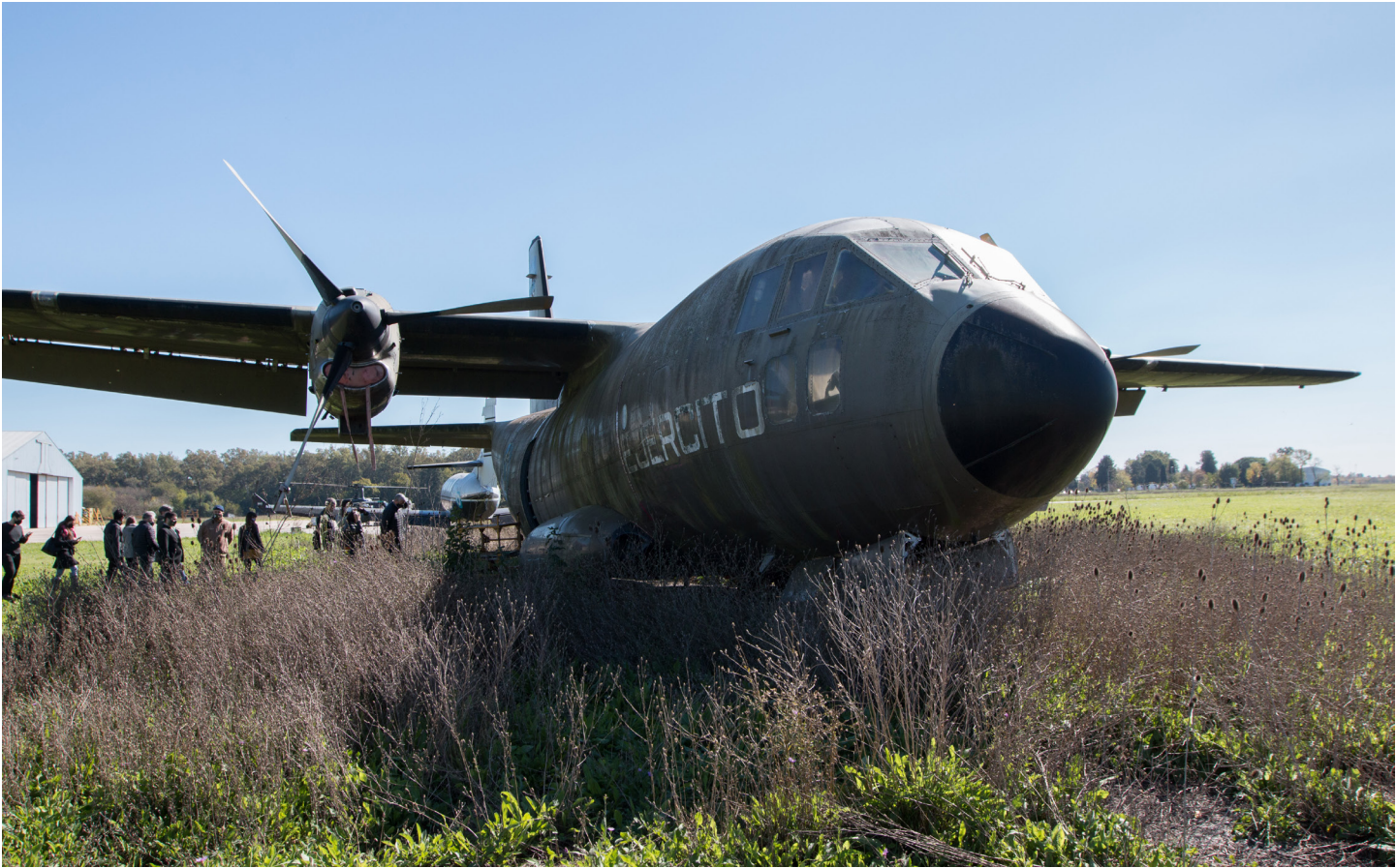
Campo de Mayo.