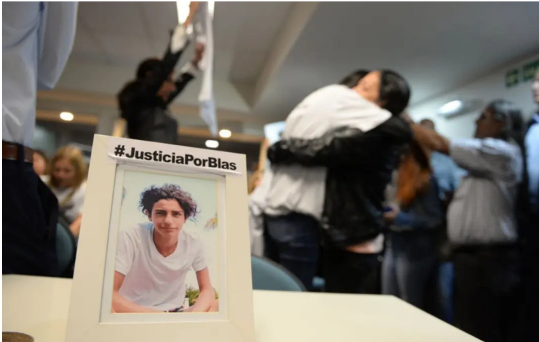
La SDH participó en juicios por casos de violencia institucional.

presenciales, destinadas al personal de fuerzas policiales, penitenciarias y áreas de seguridad en La Rioja, La Pampa, San Juan, Chaco, Tierra del Fuego, Catamarca, Santiago del Estero, Tucumán, Salta, Neuquén, Chubut, Santa Cruz y Formosa. Como resultado de esta iniciativa, se brindaron capacitaciones a más de 6000 miembros de fuerzas de seguridad.