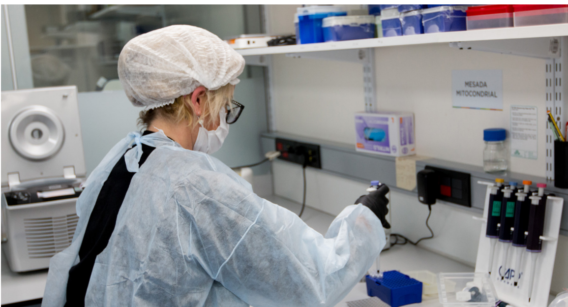
Instalaciones del Banco Nacional de Datos Genéticos.

Por otro lado, durante esta gestión debe destacarse la resolución de 7 casos de niños/as desaparecidos/as durante la última dictadura cívico militar. En 3 de ellos se logró la restitución de la identidad de las víctimas de sustracción, ocultamiento y sustitución de identidad en el marco del terrorismo de Estado: