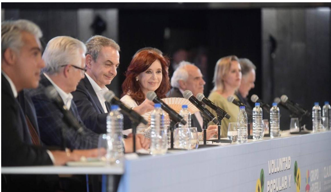
Encuentro "Voluntad popular y democracia", realizado en el marco del III Foro Mundial de Derechos Humanos.

El evento fue especialmente enriquecido por la participación activa de jóvenes, quienes contribuyeron con nuevas perspectivas. A lo largo de debates, talleres, ponencias, conversatorios, seminarios, conciertos y obras de teatro, se exploraron diversas dimensiones de los derechos humanos, consolidando así un espacio vibrante y diverso. En total, más de 15.000 personas procedentes de 98 países disfrutaron de las actividades propuestas.