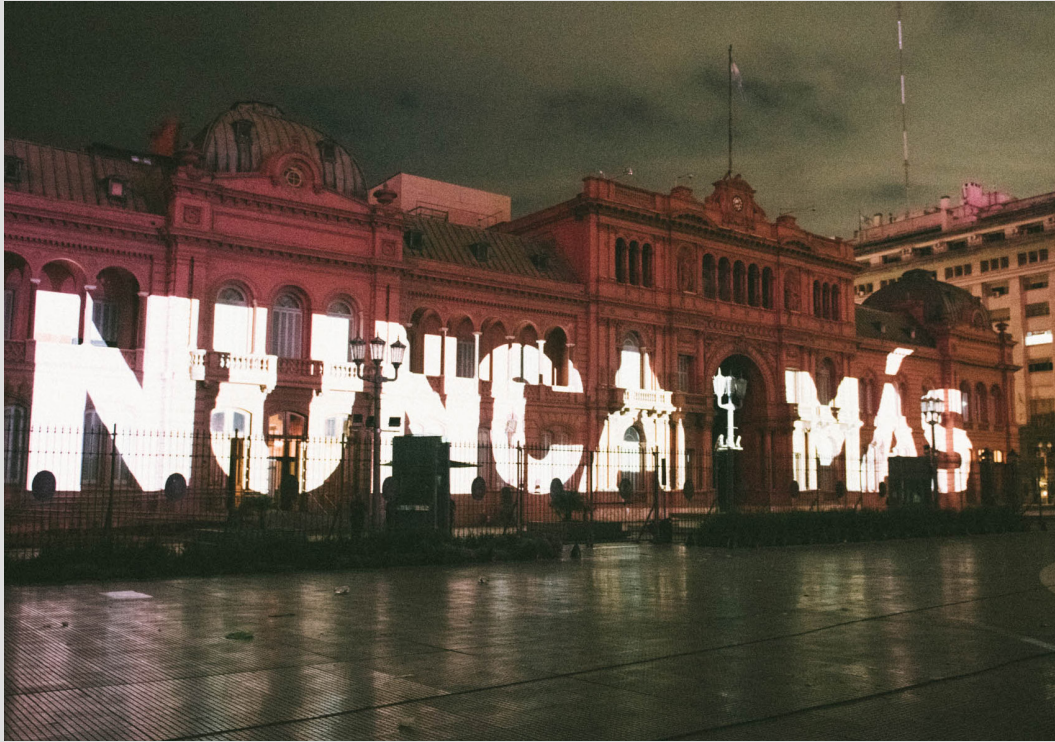
Mapping sobre Casa Rosada. Al cumplirse 45 años del golpe de Estado cívico militar, el gobierno nacional, a través del trabajo de la Secretaría, realizó un mapping sobre la Casa Rosada con una serie de imágenes y audios entre los que se destacó la frase "Nunca Más".