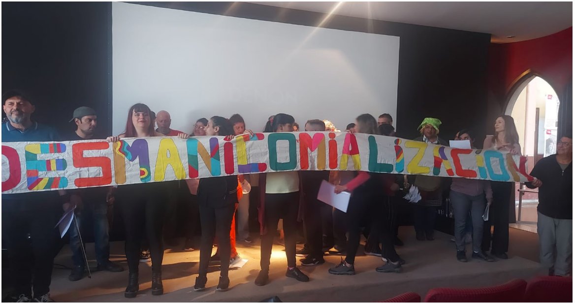
Encuentro de radios y comunicadores/as populares en salud mental.

Comisión prevista en el art. 34 de la Ley Nacional 26.657 y su reglamentación para el diseño de instrumentos de habilitación y supervisión de dispositivos de salud mental.