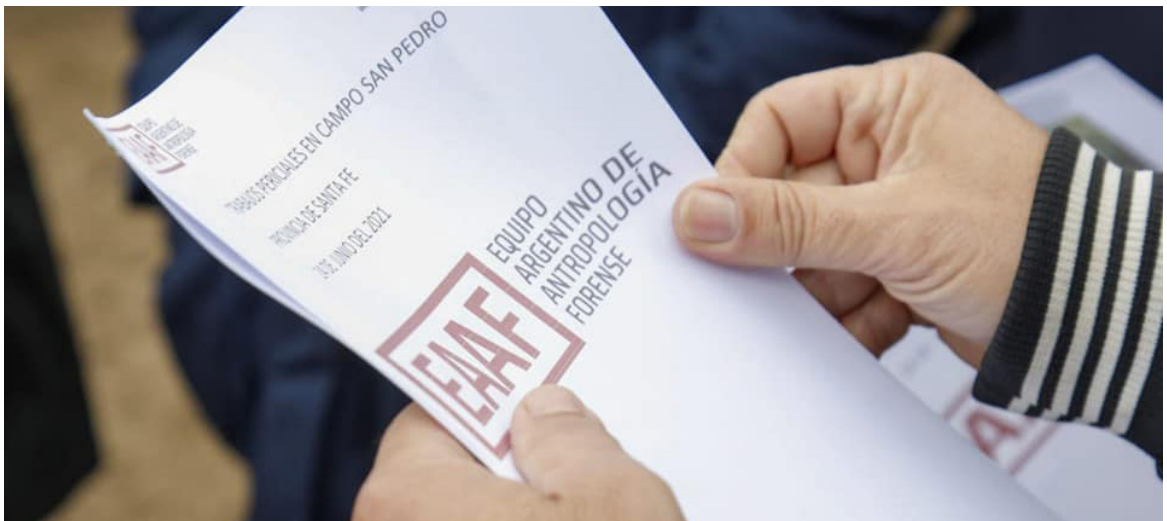
Informe sobre las tareas realizadas por el EAAF en Campo San Pedro, Santa Fe.

atravesan todo tipo de construcciones y vegetación. Este tipo de técnicas no invasivas consigue esbozar una suerte de mapa tridimensional para determinar qué hay bajo la tierra, sin alterar su superficie.