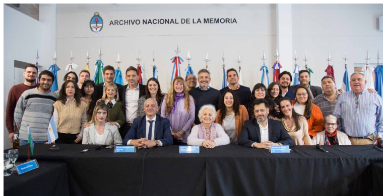
Reunión plenaria del Consejo Federal de Derechos Humanos.

En total, se gestionaron 6 Centros de Integración para Personas Migrantes y Refugiadas.