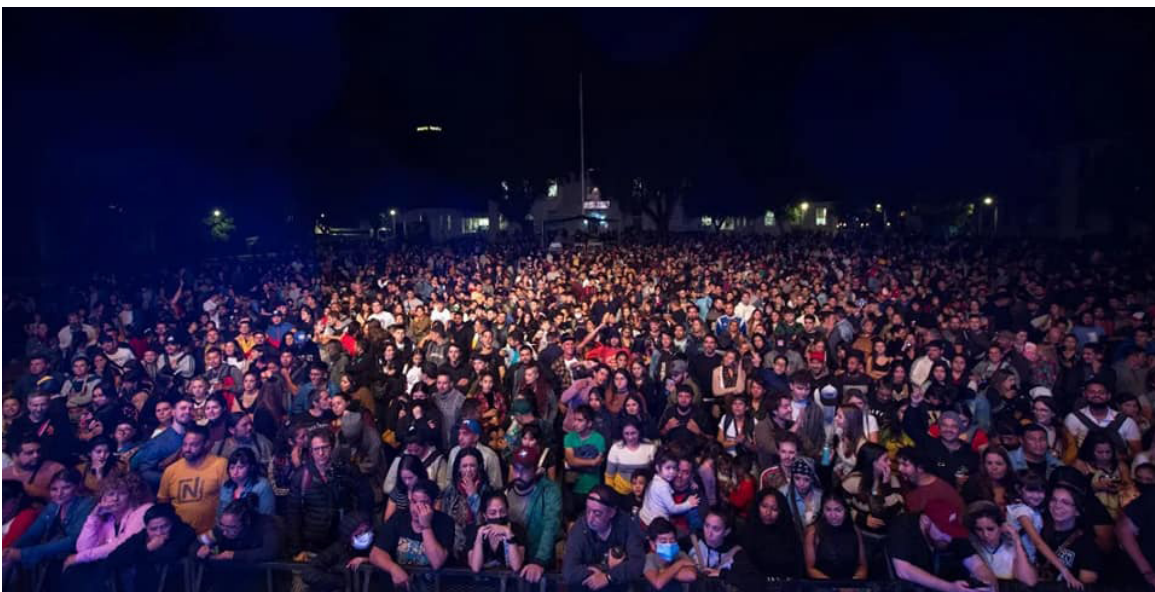
Una multitud reunida en la ex ESMA en el cierre del programa “Pasá la posta”, en marzo de 2022.

También dirigida a estudiantes secundarios, docentes y otros miembros de la comunidad educativa, desde agosto de 2021 hasta la fecha, se llevó adelante la campaña “Participar es tu derecho” para difundir y promover el derecho a la participación y a la organización que tienen los y las estudiantes secundarios en nuestro país. Se incluyeron cursos virtuales, encuentros y talleres presenciales de difusión de derechos, un micrositio con herramientas y recursos para los estudiantes. Participaron casi 8000 chicos y chicas de toda la Argentina.