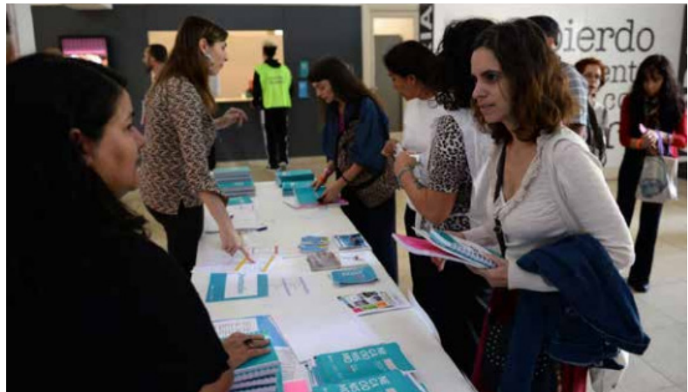
Jornadas sobre Negacionismo en el marco del III Foro Mundial de Derechos Humanos.

fin de alcanzar un acuerdo en relación con la propuesta, la Secretaría mantuvo reuniones regulares con los organismos, durante las cuales se abordaron detalladamente los aspectos específicos del proyecto presentado.