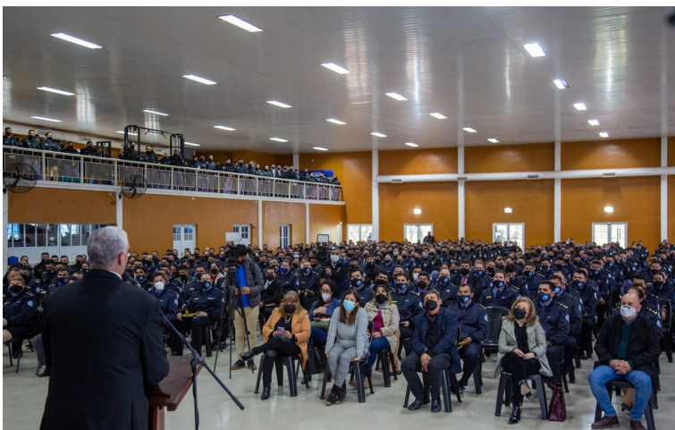
Formación en derechos humanos para agentes de fuerzas de seguridad.

3.563 casos de violencia institucional se gestionaron desde la SDH.