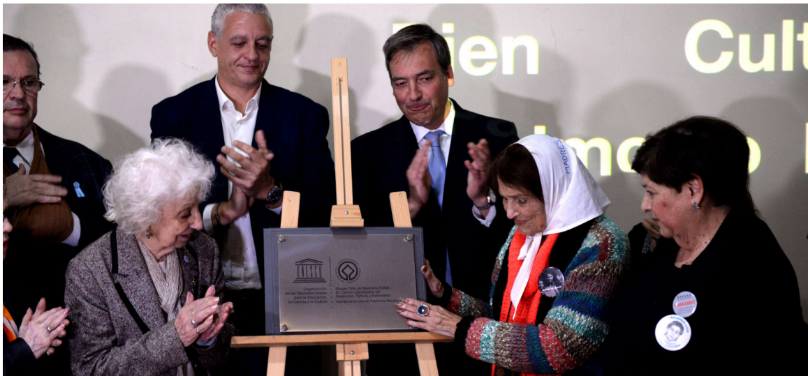
Funcionarios y referentes de organismos de derechos humanos descubren una placa conmemorativa por la declaración del Museo como Patrimonio Mundial de la Unesco.