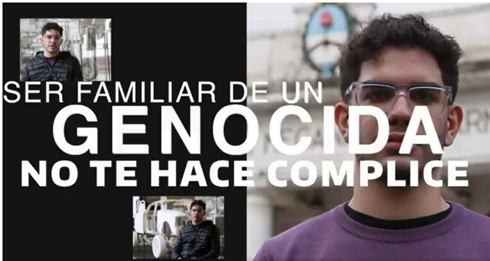
Video de difusión de la iniciativa "Ser familiar de un genocida no te hace cómplice", lanzada por la SDH.