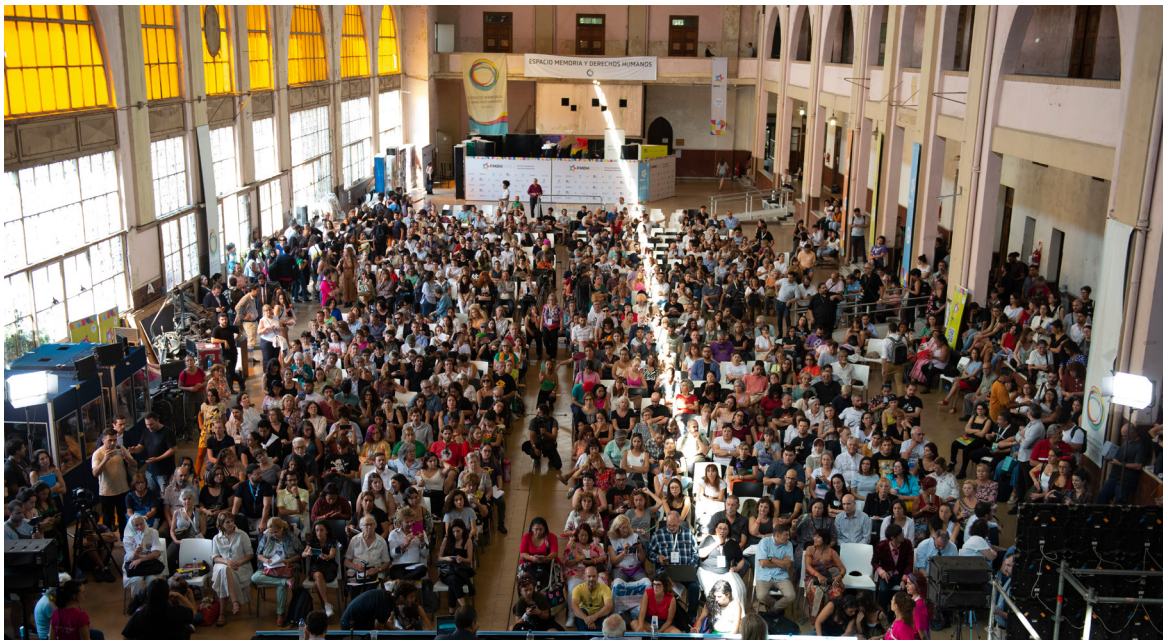
Una multitud participó de las actividades del Foro Mundial de Derechos Humanos en la ex ESMA.