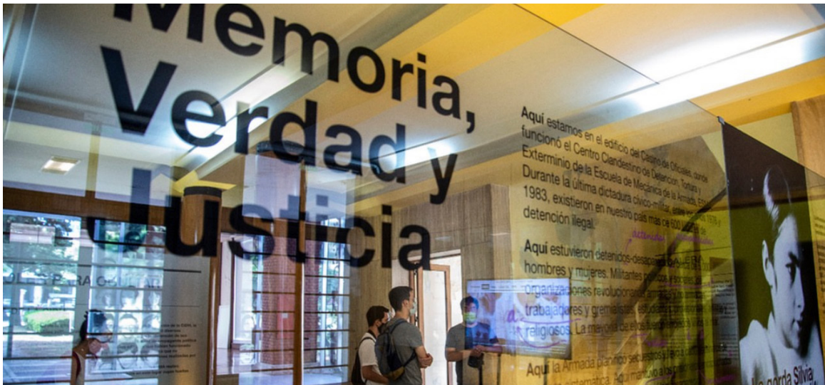
El interior del Museo Sitio de Memoria ESMA, ex Centro Clandestino de Detención, Tortura y Exterminio.