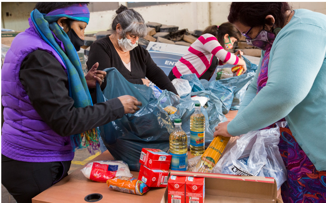
Durante la pandemia, la Secretaría junto a organizaciones de la sociedad civil brindó asistencia a miles de familias.