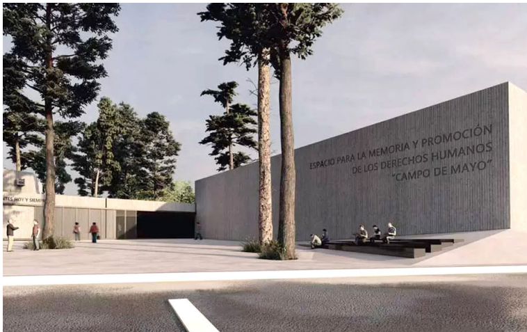
Render del Espacio para la Memoria y la Promoción de los Derechos Humanos "Campo de Mayo".

y motorizada por el Ministerio de Economía para su incorporación en el predio del Espacio Memoria y Derechos Humanos (ex ESMA) perteneciente al ámbito de la Secretaría de Derechos Humanos. De esta manera, se exhibe en el predio como un símbolo del horror de la última dictadura, como la materialización de la fase final del exterminio y como un aporte para la construcción de la Memoria sobre el terrorismo de Estado.