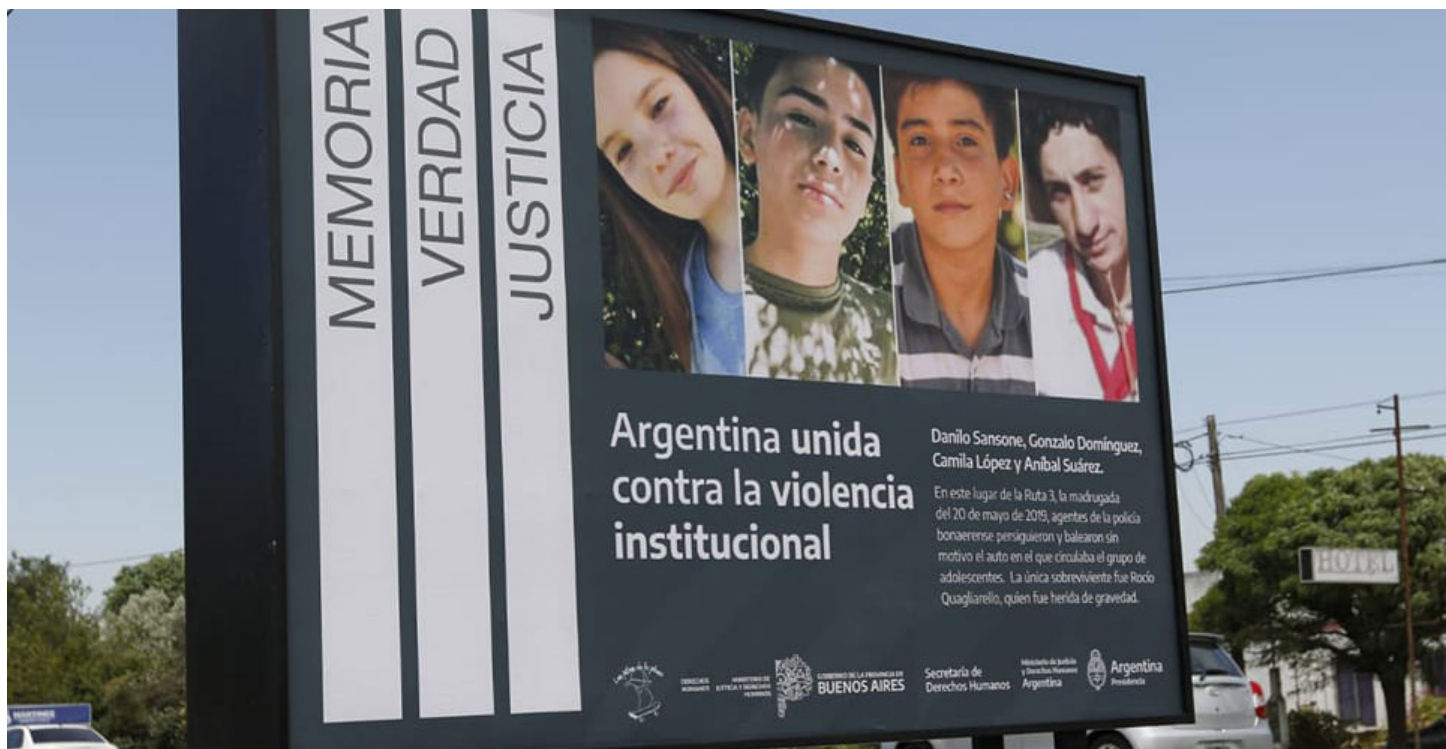
Cartel de señalización contra la violencia institucional.