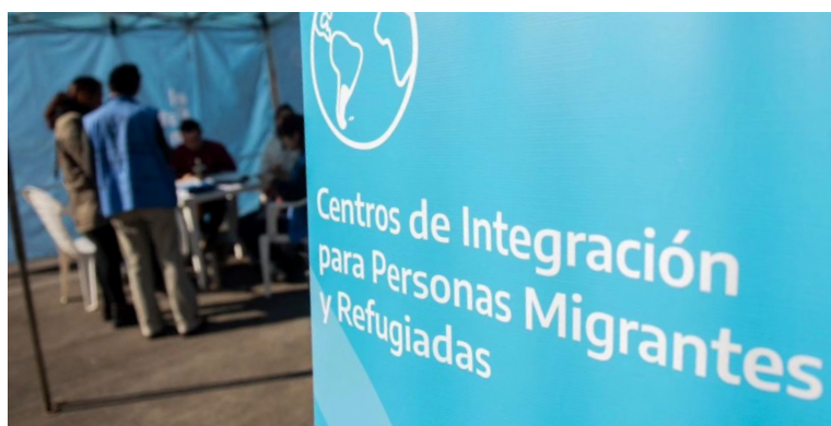
El Centro de Integración para personas migrantes y refugiadas presente en una jornada interministerial.