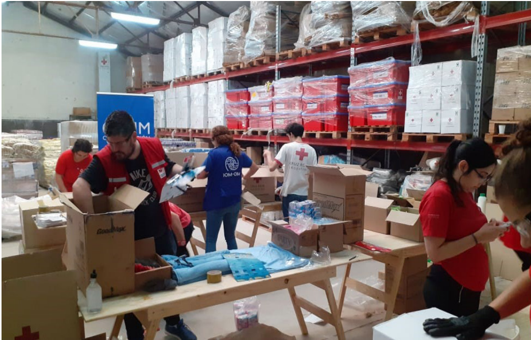
La asistencia provista por la SDH incluyó módulos alimentarios, de higiene personal y asistencia económica habitacional.

aislamiento social, preventivo y obligatorio. Las diversas solicitudes permitieron la continuidad de los juicios de lesa humanidad, que constituyen una herramienta fundamental en el camino por la Memoria, la Verdad y la Justicia.