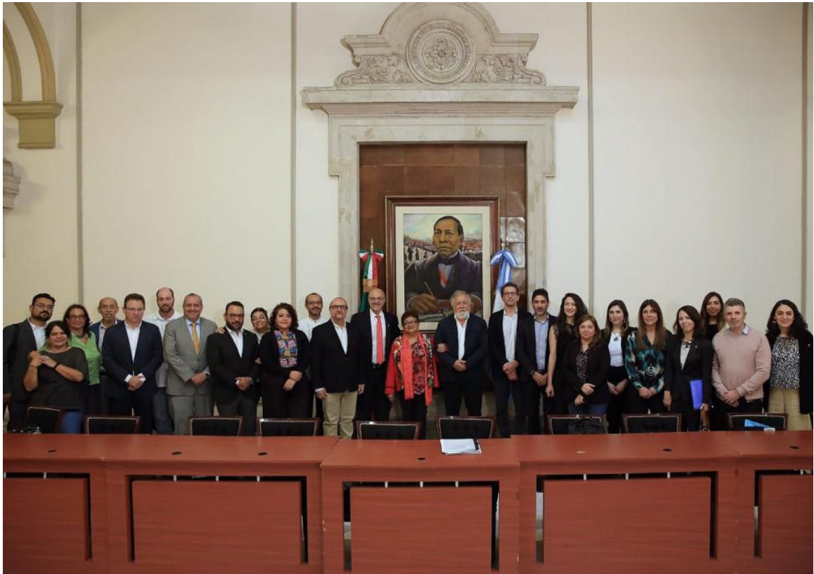
Invitado por el gobierno mexicano, un equipo de la Secretaría de Derechos Humanos viajó para aportar su experiencia en la materia.