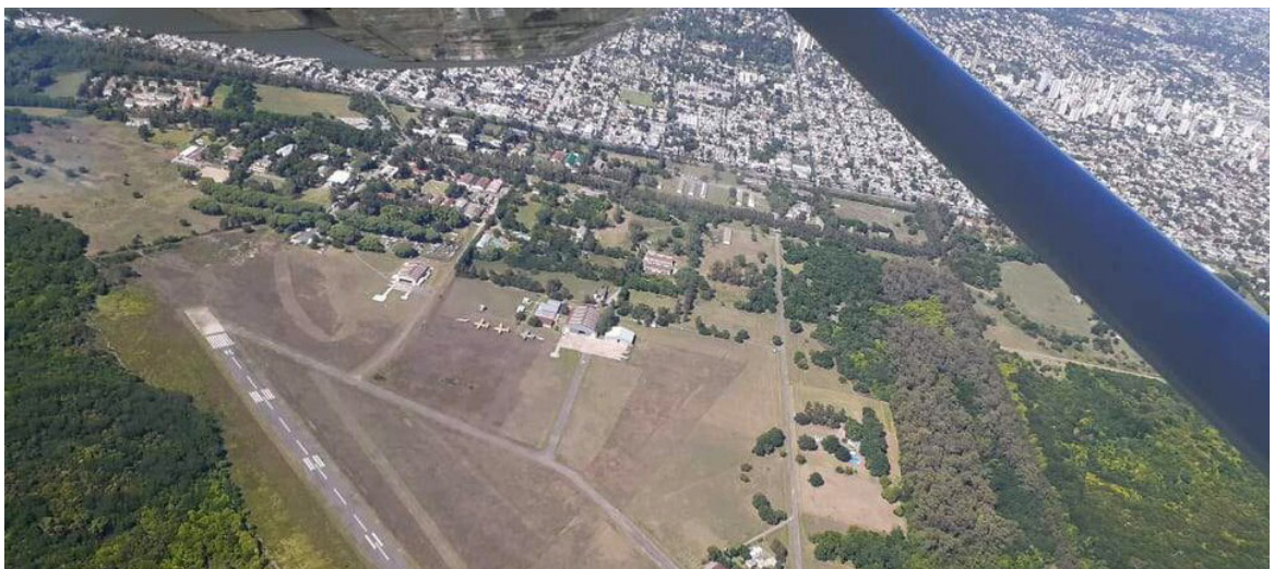
Los trabajos de relevamiento del terreno se realizaron con aviones equipados con la tecnología LiDAR.