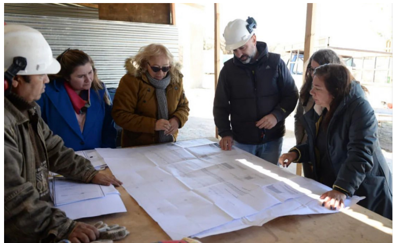
Los equipos de la Secretaría y del Ministerio de Obras Públicas revisan el plano de la obra de puesta en valor del Sitio de Memoria "Escuelita de Bahía Blanca".

Se proyectaron o abrieron 3 nuevos Espacios de Memoria: Campo de Mayo, el Vesubio y Regimiento de Infantería 9 "Coronel Pagola".