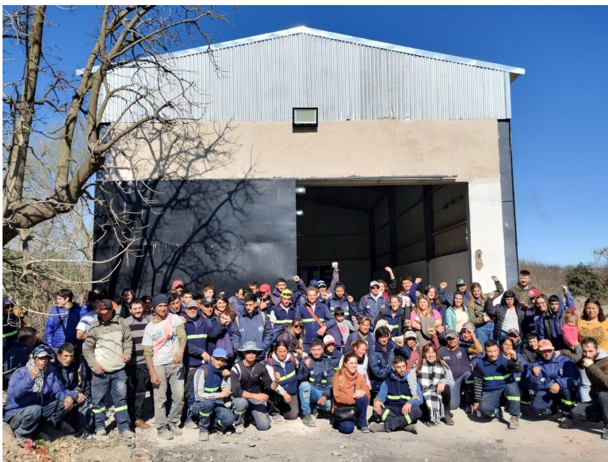
Recuperadores del BCA en inauguración del galpón

Para el funcionamiento del galpón, se realizó la entrega de equipamiento por parte del Programa Argentina Recicla 16 , del Ministerio de Desarrollo Social de la Nación que busca promover la inclusión social y laboral de las y los recuperadores de todo el país. El equipamiento permite garantizar una mejora en el trabajo de los recuperadores del BCA de Luján, garantizando el acondicionamiento de los materiales que recuperan para la posterior venta colectiva a la industria. A su vez, la entrega de uniformes permite una mejora en las condiciones de seguridad en el trabajo, por ejemplo, con botines de seguridad y guantes para evitar cortes y accidentes laborales.