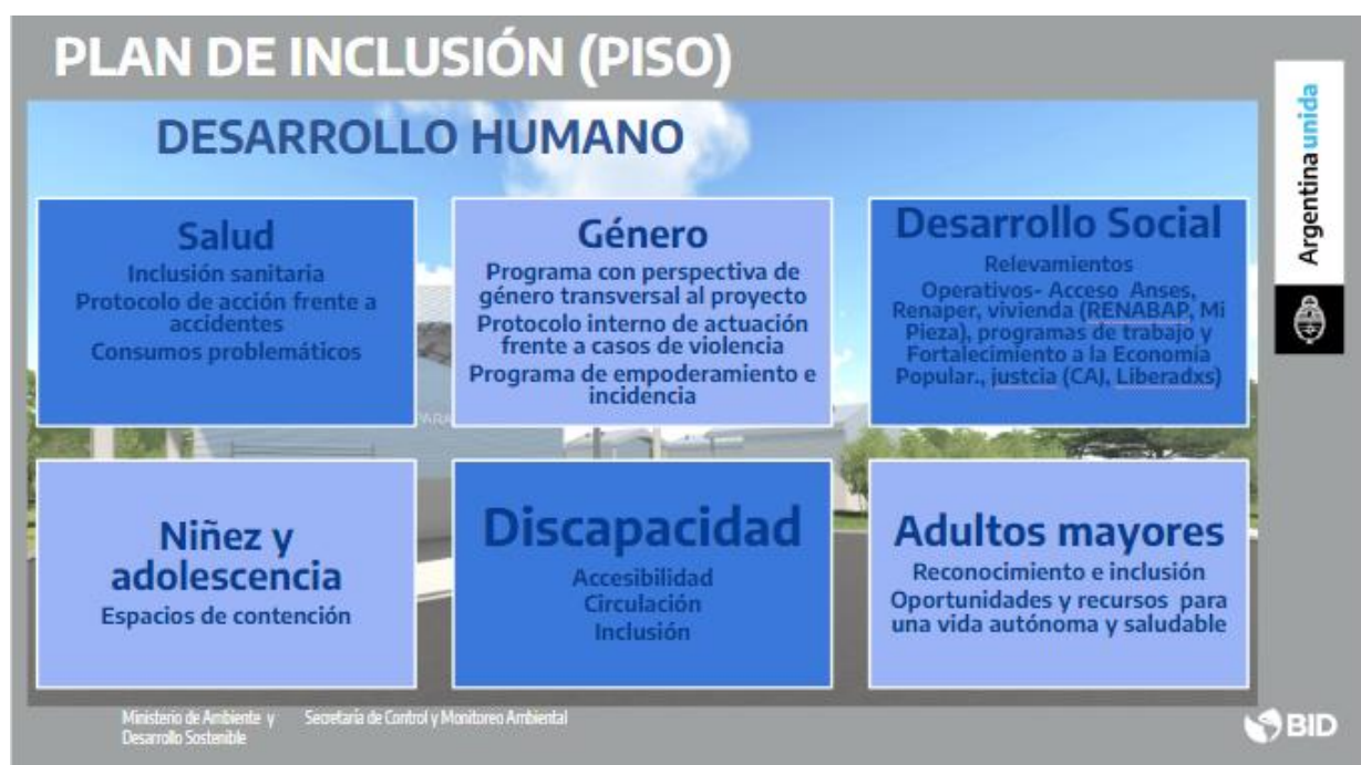
Imagen: Principales áreas involucradas en Mesa de Desarrollo HUmano 24

El Programa de Desarrollo Humano está compuesto por los proyectos de Desarrollo Social, Desarrollo de Salud y de Desarrollo de Educación, los que se presentan a continuación y las diferentes situaciones serán abordadas en las Mesas de Desarrollo Humano creadas para tal fin.