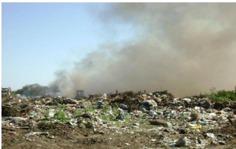
Foto 1. Quema en el BCA de Luján, cercano al Bloque de los Santos 7

Respecto a los hogares, 14 (35%) no poseen hijos, 14 (35%) posee 1 hijo, 1 posee 2 hijos, 4 (10%) poseen 3 hijos y 7 (18%) posee 4 o más hijos. Asimismo, 9 recuperadores (22%) son jefes de hogar, incluyendo a 4 de las 5 mujeres encuestadas (2 tienen hijos y 2 no tienen). Los hogares de 3 recuperadores (8%) son unipersonales.