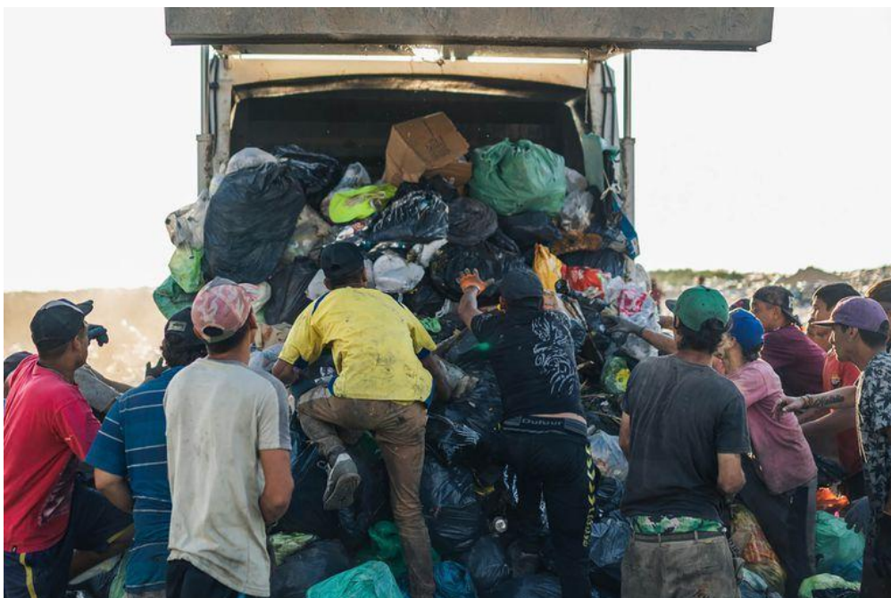
Foto 2. Momento de descarga de camiones en el basural de Luján 10

Unos 10 recuperadores rodean la pila de bolsas de residuos volcada, apropiándose de ellas y ubicándose en la proximidad, para luego iniciar la separación, clasificación, y colocación en bolsones. Esta tarea la hacen individualmente, o de a dos o tres personas, que suelen ser familiares o amigos, no siendo eficiente el trabajo asociado entre más personas.