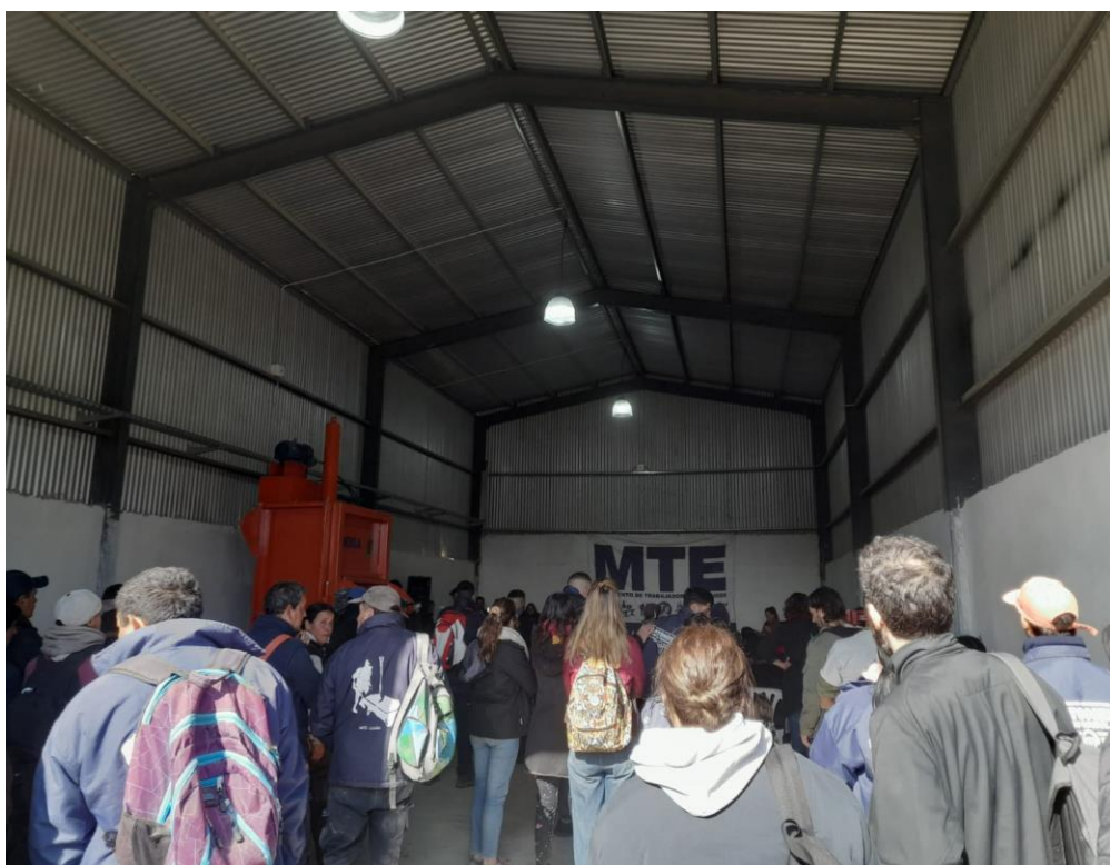
Inauguración del galpón en el ingreso al BCA - Viernes 5-8-2022

El galpón construido en el ingreso al BCA significa un espacio clave para garantizar el trabajo seguro de los recuperadores, especialmente en el momento de transición, es decir, mientras se desarrollen las obras en el BCA.