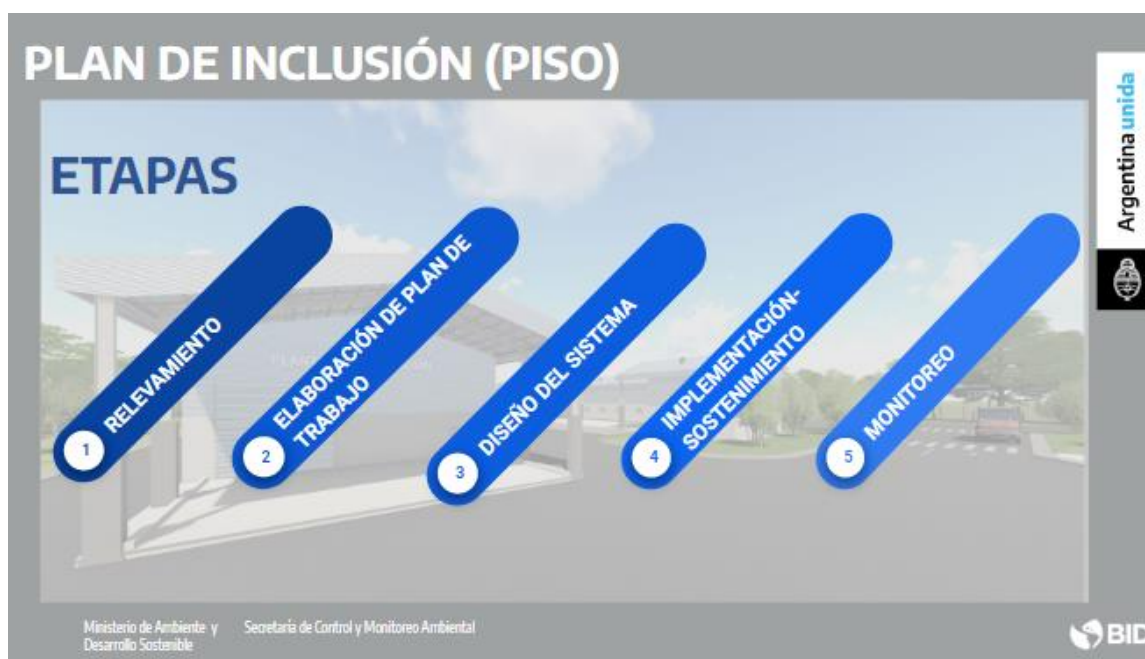
Imagen: Etapas del PISO

El equipo técnico social del Ministerio de Ambiente y Desarrollo Sostenible (MAyDS) plantea un abordaje del PISO en las siguientes etapas: