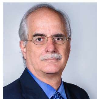
Lic. Jorge Taiana

Vivimos en un mundo en constante reconfiguración, con tensiones y disputas pero también con desafíos y oportunidades para la cooperación y el fortalecimiento de un sistema más multipolar.