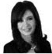
Cristina Fernández de Kirchner