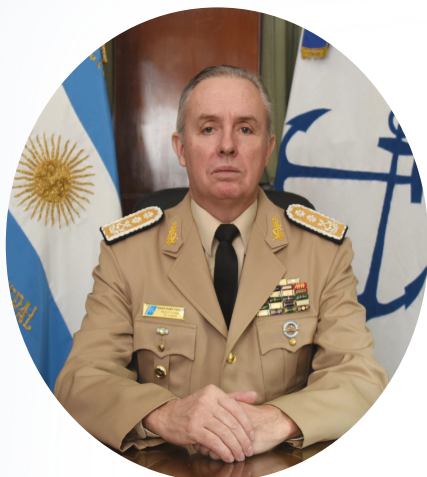
Prefecto General Mario Ruben Farinón Prefecto Nacional Naval