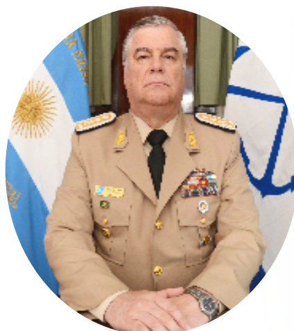
Prefecto General Jorge Raúl Bono Sub-Prefecto Nacional Naval