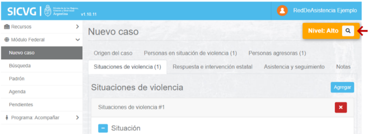
Fig. 1 Visualización de la medición de riesgo en el sistema. Ejemplo a partir del Módulo Federal del SICVG.

En caso de encontrarse habilitado en el módulo del cual se ingrese, el nivel de riesgo se muestra en un semáforo en la esquina superior derecha.