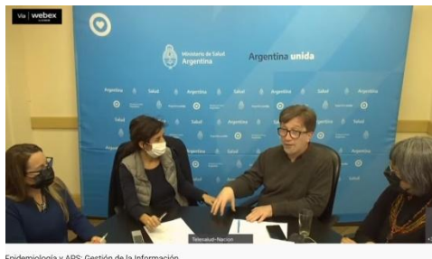
Epidemiología y APS: Gestión de la Información.

El nuevo espacio de formación regional , destinado a equipos de salud del primer nivel de atención de determinadas zonas del país, contó con 2 encuentros realizados durante el mes de mayo.