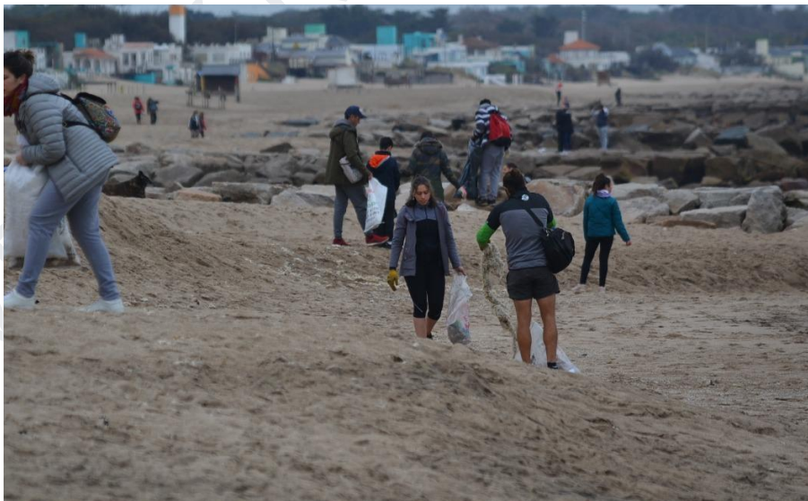
Imagen: Limpieza de Playas