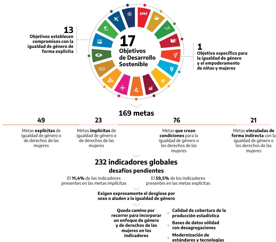
Ilustración 2 Transversalización de género en la producción estadística para el monitoreo de los ODS- Agenda 2030