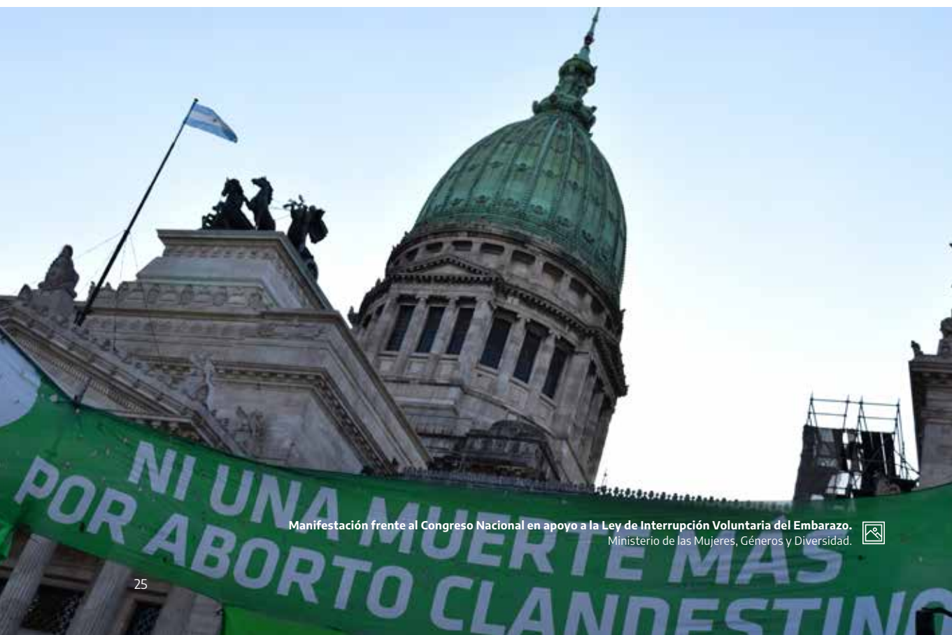
Manifestación frente al Congreso Nacional en apoyo a la Ley de Interrupción Voluntaria del Embarazo. Ministerio de las Mujeres, Géneros y Diversidad.