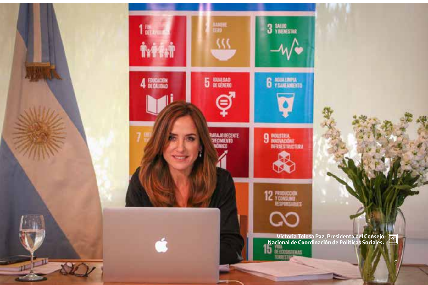
Victoria Tolosa Paz, Presidenta del Consejo Nacional de Coordinación de Políticas Sociales.

En esta publicación se tratan inicialmente, los antecedentes internacionales y nacionales relacionados con la igualdad entre los géneros, tanto en la implementación de la Declaración del Milenio como de la Agenda 2030. Posteriormente, se aborda la institucionalidad de género y diversidad en la política nacional desde el retorno de la democracia a la fecha de esta publicación. Asimismo, se describen y analizan las acciones de aceleración para la incorporación de la perspectiva de género y diversidad en la acción del Estado. Finalmente, se plantean los desafíos para la inclusión de la perspectiva de género y diversidad en la Agenda 2030.