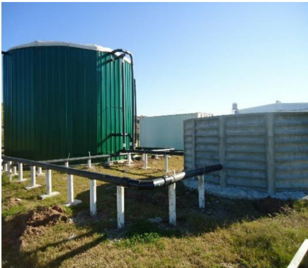
Figura 2. Planta Piloto de Biodigestión