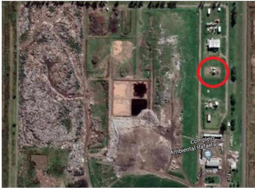
Figura 1. Ubicación de la Planta Piloto de Biodigestión (círculo rojo)