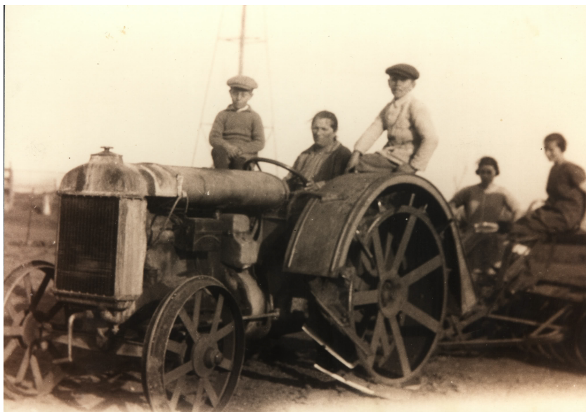
Sin fecha. Familia rural en el departamento de Gualeguay.

Ahora te invitamos a buscar alguna foto de tu archivo personal, que puede ser de tu niñez o del pasado más reciente, donde esté representada una escena de cuidado. Si no tenés acceso a una foto, podés recordar alguna situación que sirva de ejemplo.