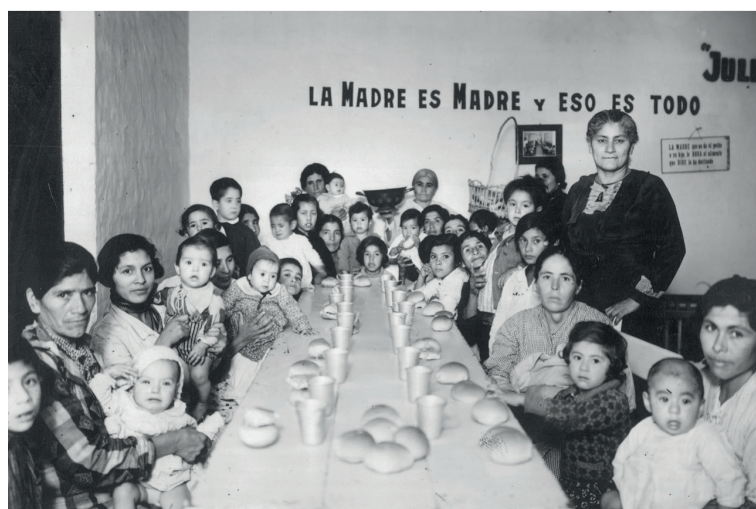
1936, Santiago del Estero “Una merienda de madres y lactantes en la Cantina Maternal”.

Una vez que hayas respondido estas preguntas, te invitamos a reflexionar sobre los estereotipos de género relacionados a los cuidados: