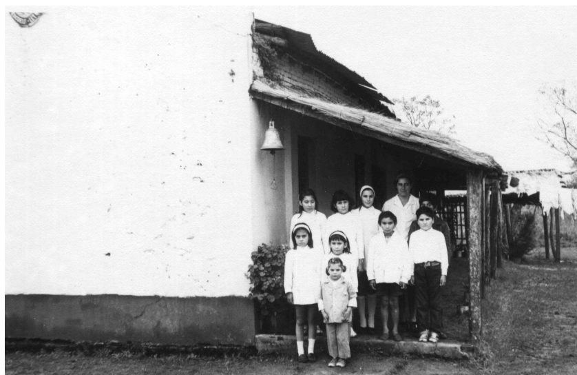
1969. Escuela Rural en Curuzú Cuatiá.

“Memoria colectiva de los cuidados” es una muestra fotográfica que propone un recorrido histórico de los trabajos de cuidado en Argentina durante el siglo XX, realizada por el Ministerio de las Mujeres, Géneros y Diversidad de la Nación junto al Archivo General de la Nación con la participación de los Archivos Históricos provinciales y el Archivo de la Memoria Trans en el marco de la Campaña Nacional “Cuidar en Igualdad” .