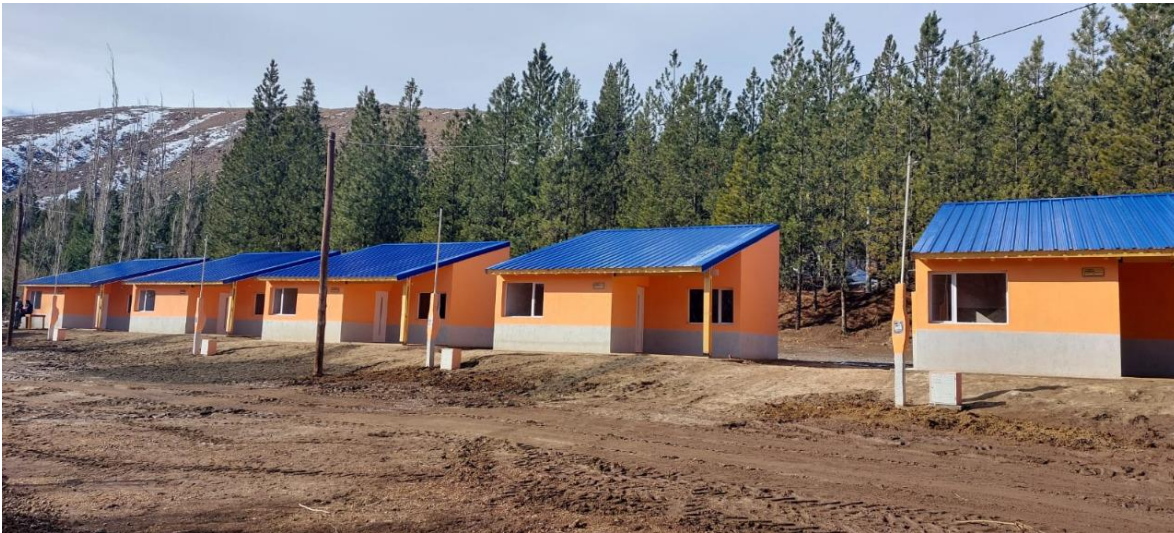
Fotografías de viviendas entregadas en la localidad

En respuesta a esta situación problemática, las demandas ciudadanas manifiestas que de manera recurrente la ubicaron como principal problema de su localidad, el Presidente de la Comisión de Fomento de Varvarco toma la iniciativa y, el 21 de diciembre del año 2020, aprueba por resolución el compromiso institucional de beneficiar con un lote propio a personas oriundas de la localidad que completen sus estudios terciarios o universitarios y retornen a ejercer la actividad laboral en dicha localidad, con el objetivo de evitar el desarraigo y la migración de los profesionales jóvenes a otras localidades. Posteriormente, el 19 de mayo de 2022, se ratifica dicha resolución mediante la Declaración de Interés N° 3278 del Poder Legislativo de Neuquén, aprobada por unanimidad. Se considera que ambas disposiciones ofrecen un marco regulador para el acceso al suelo urbano atendiendo, en parte a la problemática del éxodo de la población objetivo.