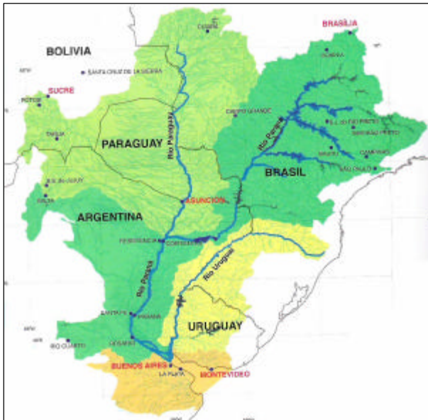
Cuenca del Plata

En menor proporción se encuentran las siguientes ecorregiones.