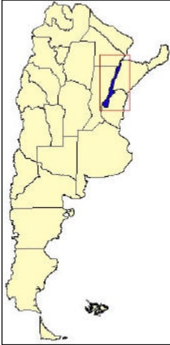
Cuenca N° 17