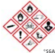
*SGA = Sistema Globalmente Armonizado